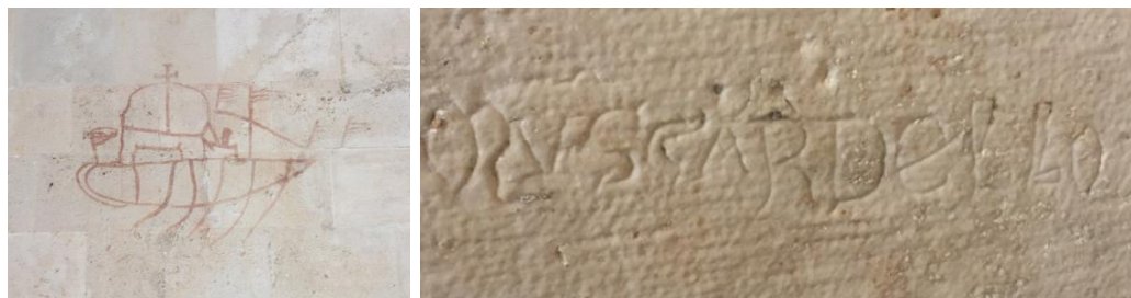
Slika 8. "grafit" lađe; potpis majstora Muscardella