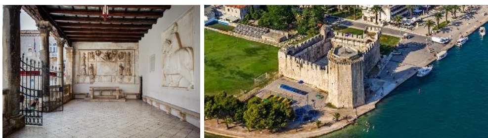
Slika 4. trogirski gradska loža; Kula Kamerlengo