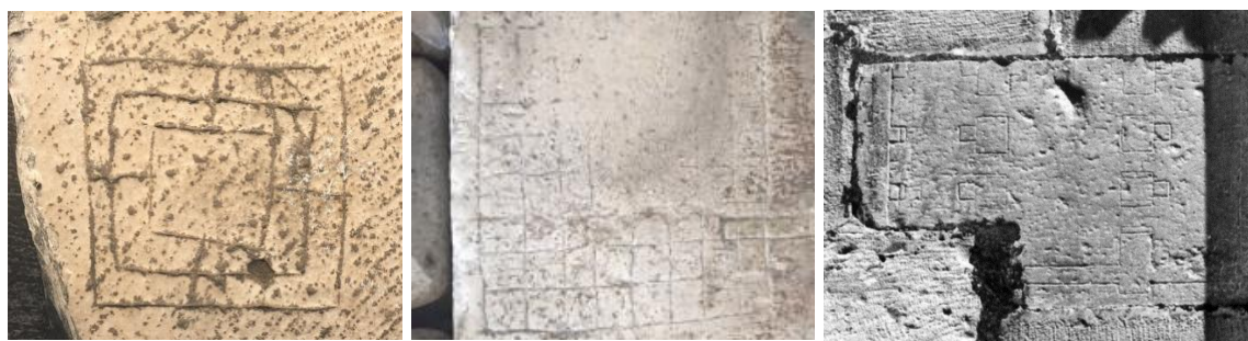
Slika 7. uklesane igre trilje i šaha; nacrt građevine