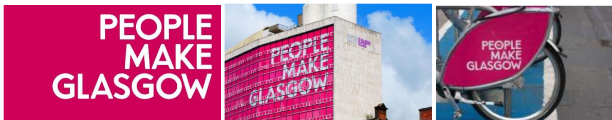
Slika 2. Glasgow – implementacija vizualnog identiteta slogana u prostoru