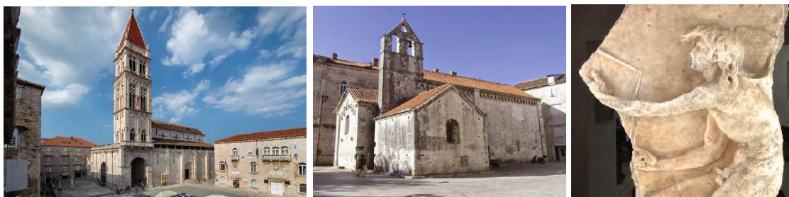
Slika 3. Katedrala sv. Lovre; crkva sv. Ivana Krstitelja; reljef Kairosa