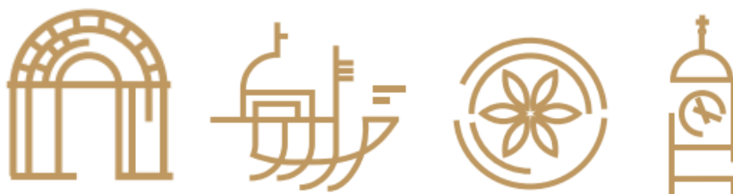
Slika 11. piktografi