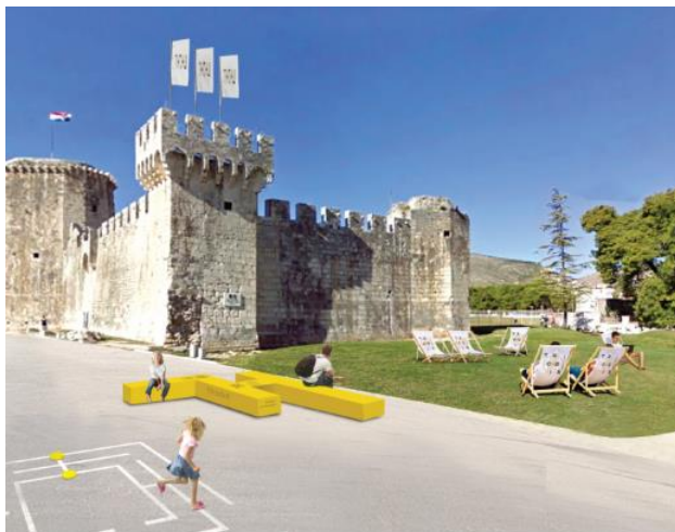
Slika 12. primjena vizuala u prostoru