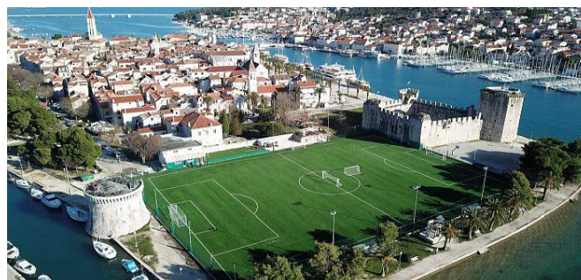
Slika 13. nogometno igralište Batarija