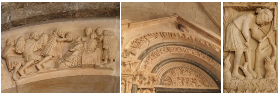
Slika 5. portal majstora Radovana na katedrali sv. Lovre u Trogiru