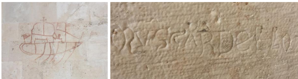
Slika 8. "grafit" lađe; potpis majstora Muscardella