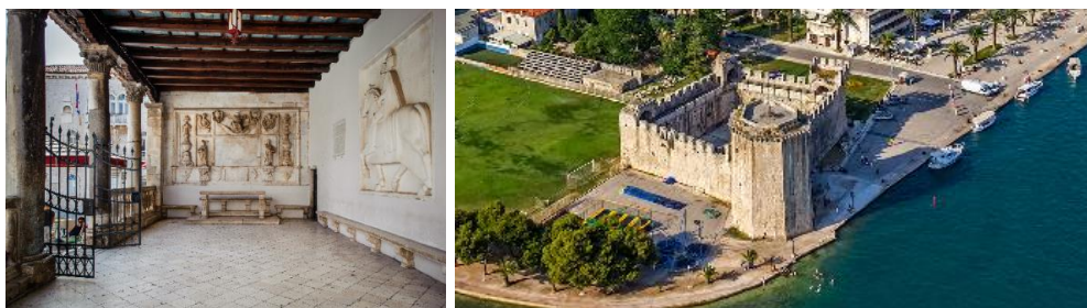
Slika 4. trogirski gradska loža; Kula Kamerlengo