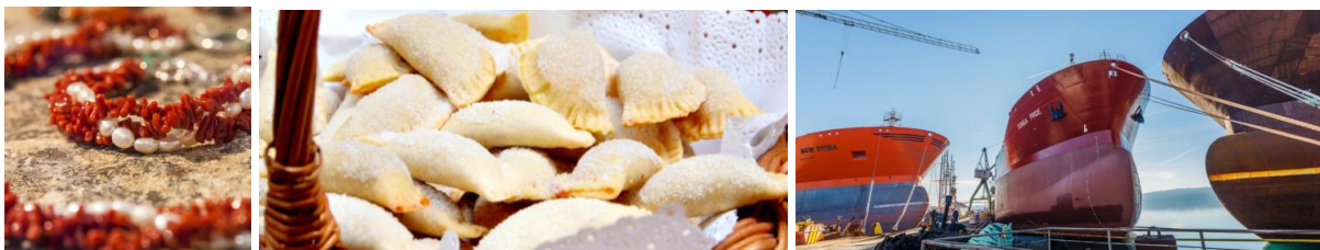
Slika 6. proizvodi trogirskih majstora (narukvica od jadranskih koralja, rafioli, brodovi)