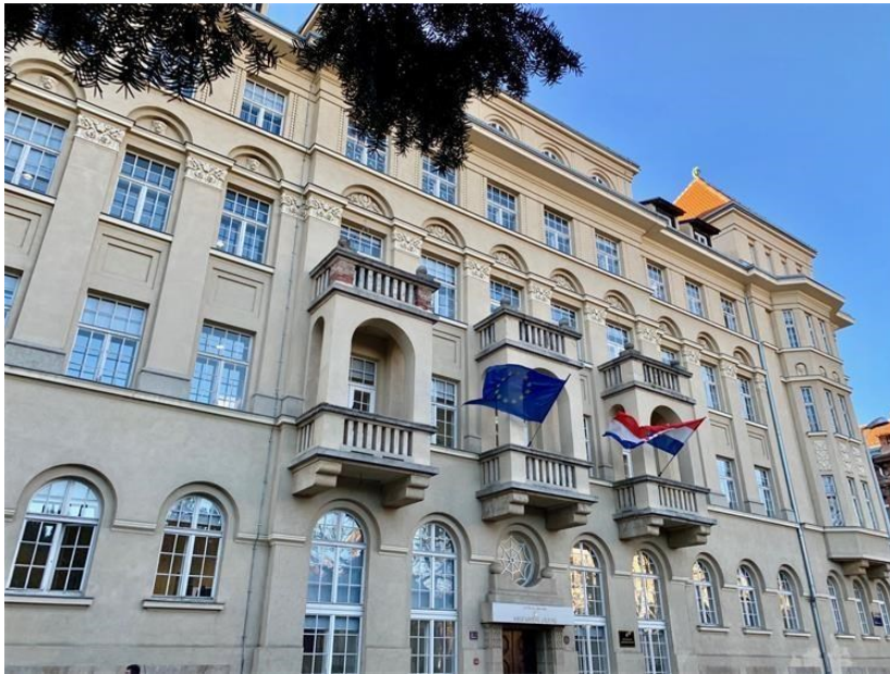
Slika 6: Ministarstvo kulture i medija