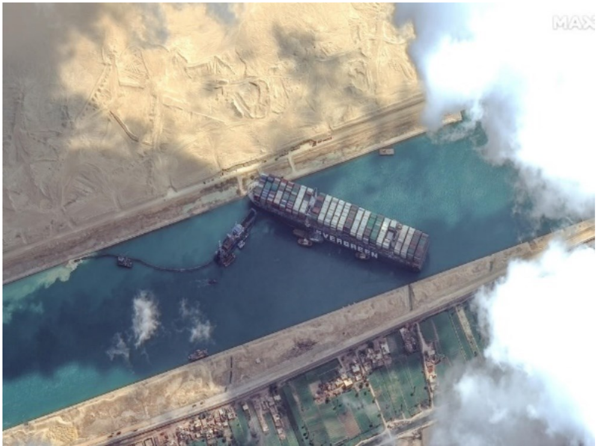
Slika 3. Satelitska slika Sueskog kanala i broda Ever Given