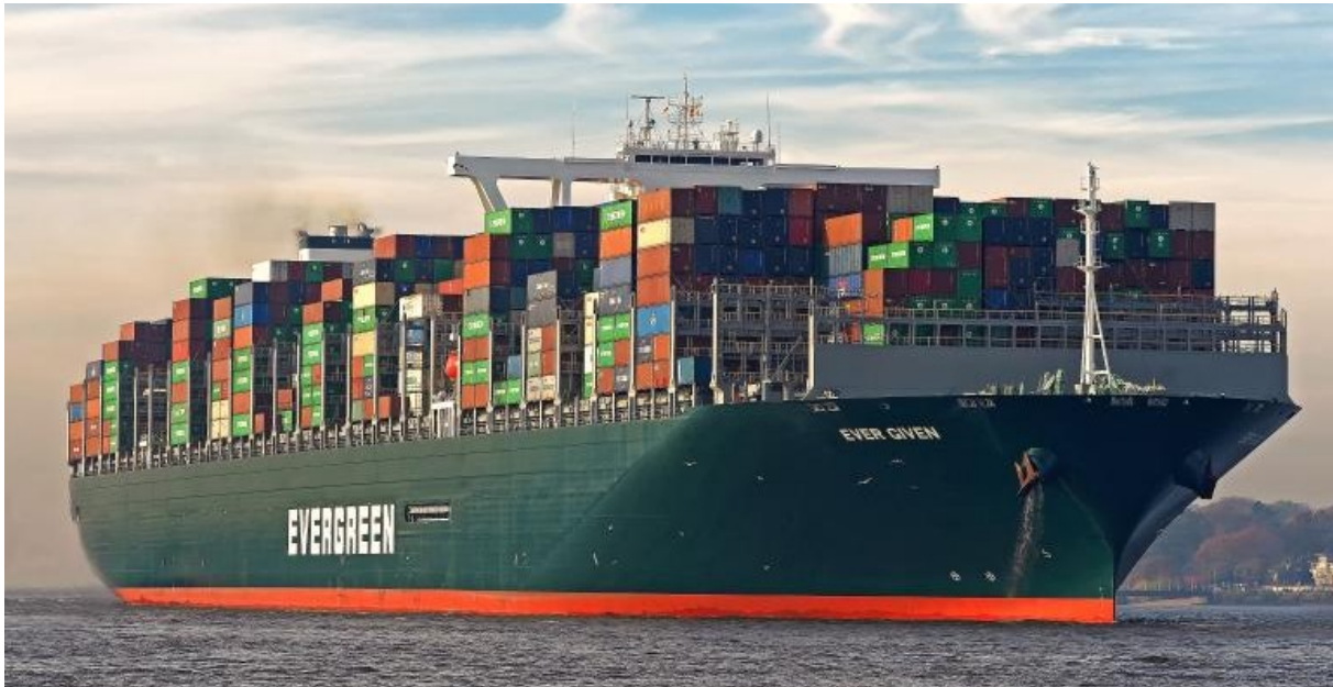
Slika 1. Ever Given

Studija slučaja rađena je na primjeru jednog od najvećih kontejnerskih brodova na svijetu naziva Ever Given (Slika 1).