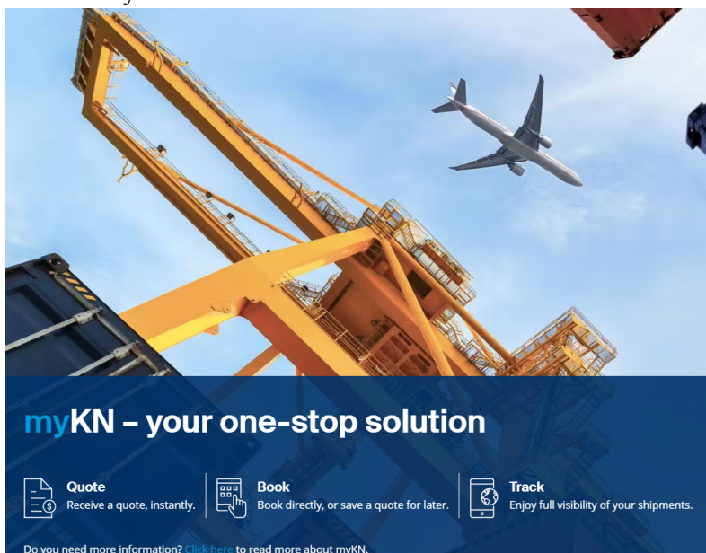
Slika 4. MyKN

K&N je lansirao MyKN 2018. godine, a to je platforma za rezervacije zračnog, pomorskog i cestovnog tereta, koja nudi rješenje na jednom mjestu za pošiljatelje. K&N je uspostavio tri inovacijska centra za digitalnu transformaciju 2018. godine u Utrechtu, Singapuru i Johannesburgu (FreightTech, 2020). MyKN aplikacija dodatno olakšava i poboljšava interakciju između kupaca i tvrtke. Pokretanjem myKN aplikacije korisnici su dobili jedinstvenu točku pristupa svim online uslugama. myKN omogućuje istraživanje, ponudu, rezerviranje i praćenje, kao i upravljanje pošiljkama i korisničkim računima u cijelosti online na samouslužnom portalu (Kuehne-Nagel, 2020).