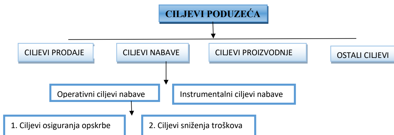
Slika 2. Ciljevi poduzeća