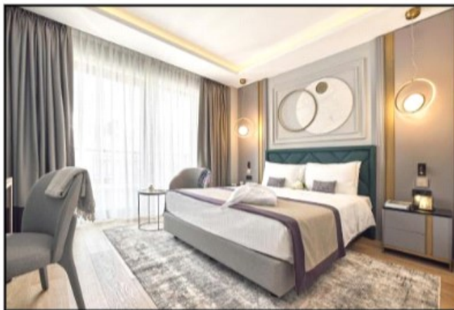
Slika 1. Le Fleur hotel