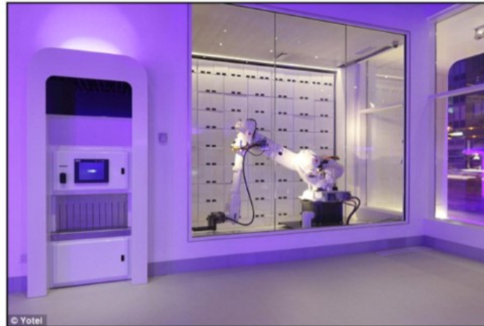
Slika 6. Robot Yotel