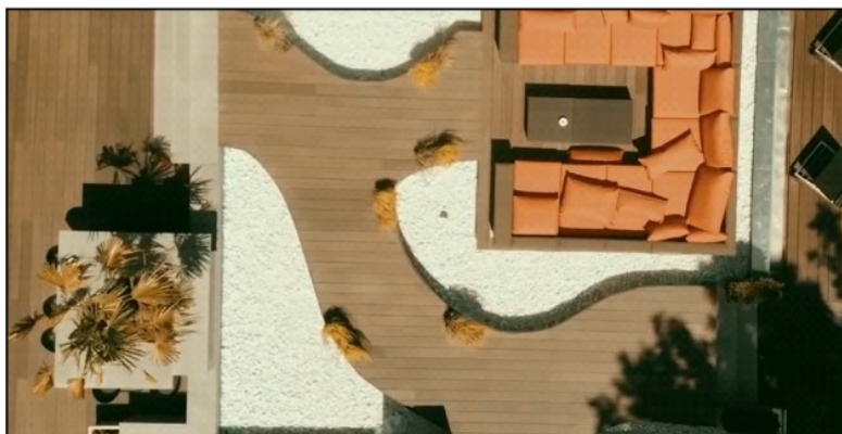
Slika 4. Hotel Silken Puerta America Madrid

Hotel Silken Puerta America nadilazi sve arhitektonske standarde. Svaki od 12 katova u ovom tornju duginih boja pažljivo je dizajniralo devetnaest vrhunskih arhitekata. Nadalje, u prizemlju hotela se pruža mogućnost korištenja sobe za sastanke i događaje čiji je kapacitet 1000 osoba. Nadalje, sve prostorije u hotelu su opremljene visokom tehnologijom, koja privlači posjetitelje diljem svijeta. (Berman, 2019)