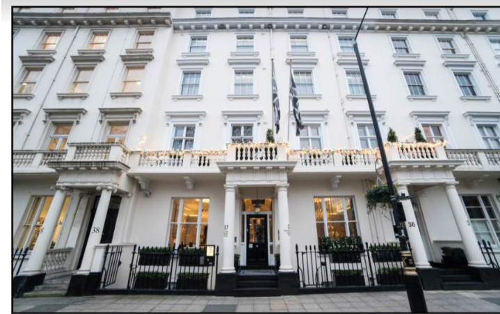
Slika 7. Eccleston Square Pimlico u Londonu