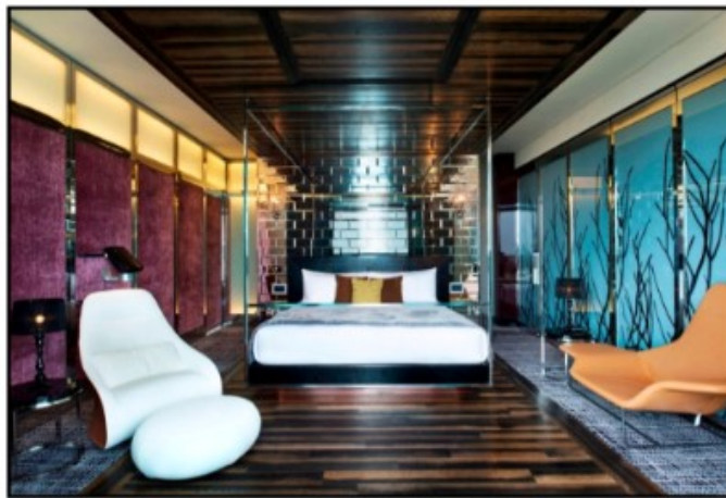
Slika 2. Unutarnji izgled hotela W Singapore