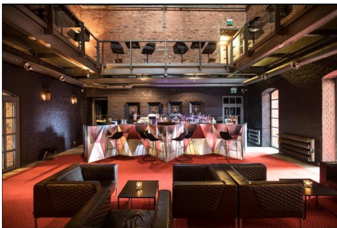
Slika 10. Blow Up Hall 5050