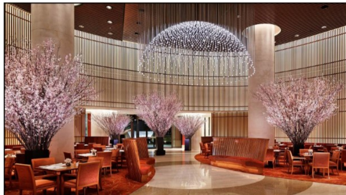
Slika 5. Peninsula Hotel Tokio