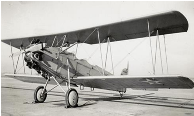
Slika 4: Curtiss N2C-2