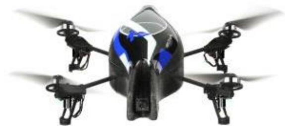
Slika 7: Parott AR Dron