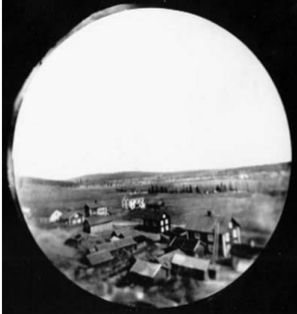
Slika 1: Prva dokumentirana fotografija iz zraka snimljena kamerom pričvršćenom za raketu