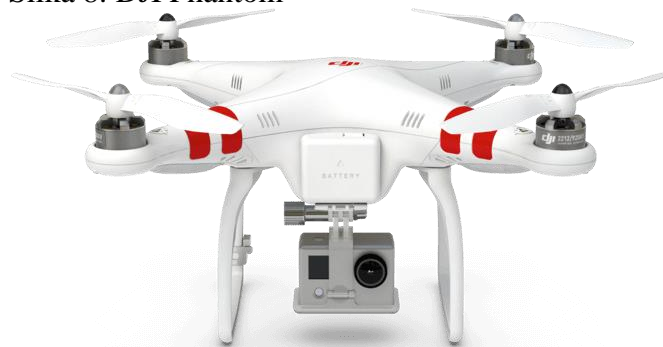
Slika 8: DJI Phantom