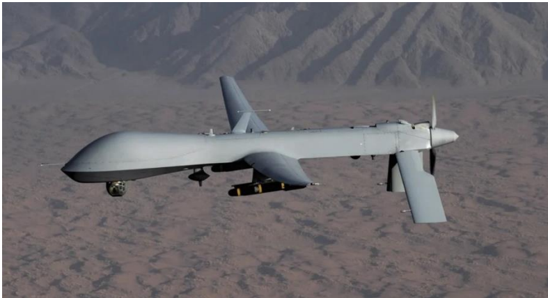
Slika 6: Predator