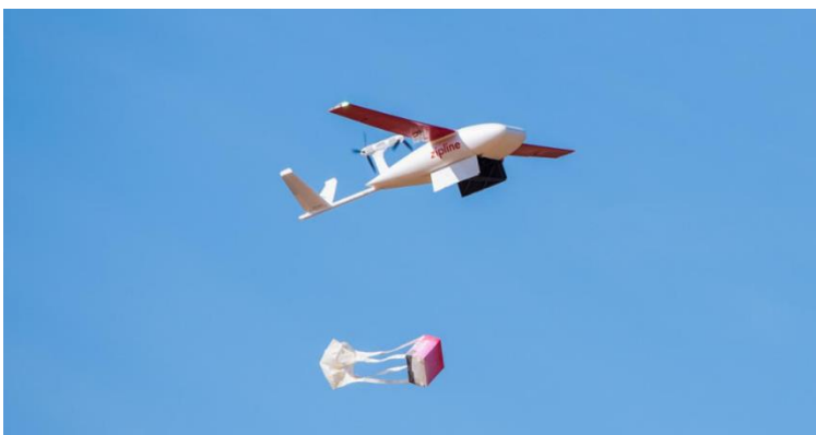
Slika 10: Trenutni način dostave dronom tvrtke Zipline