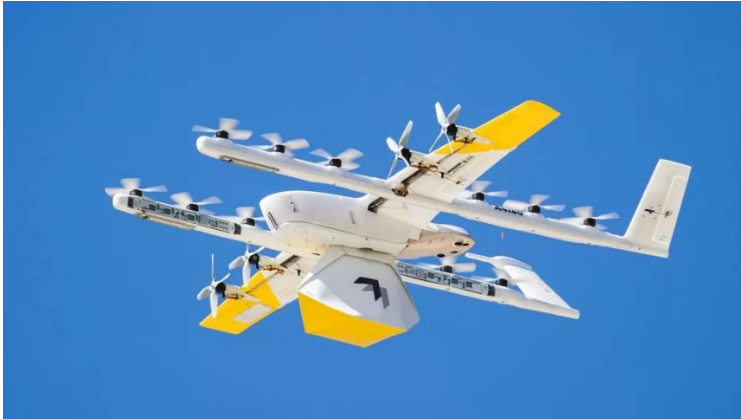
Slika 9: Wing-ov dostavni dron