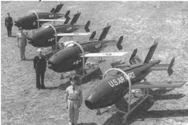
Slika 5: Ryan Firebee