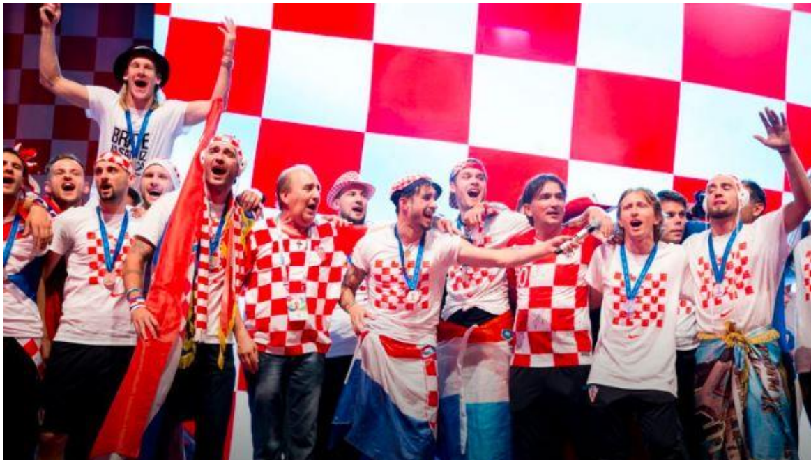
Slika 3. Hrvatska osvaja drugo mjesto na SP-u u Rusiji