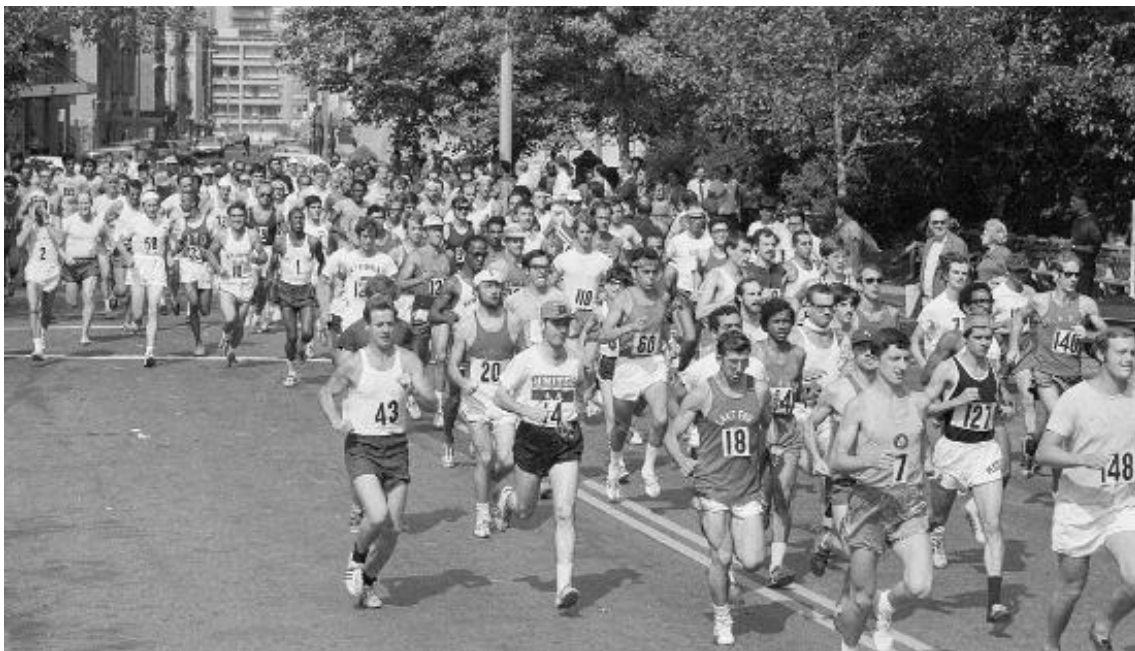
Slika 2. Prvi maraton u New Yorku