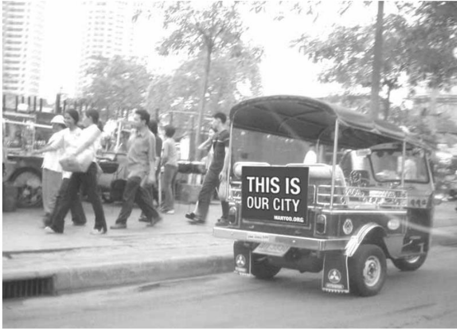
Slika 2. This is Our City kampanja na ulicama Tajlanda

Izvor: Edensor, T., Millington S. (2008.), This is Our City: branding football and local embeddedness.