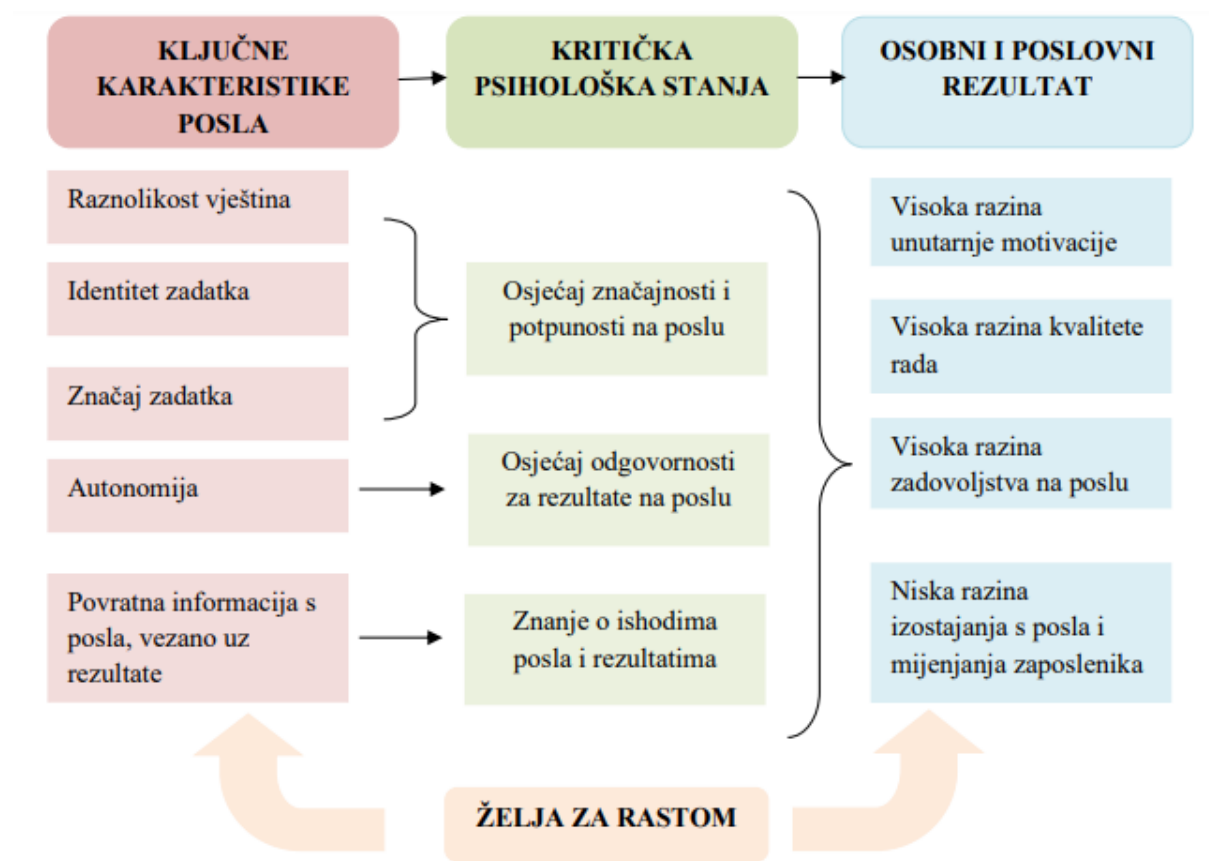
Slika 1. Model karakteristika posla