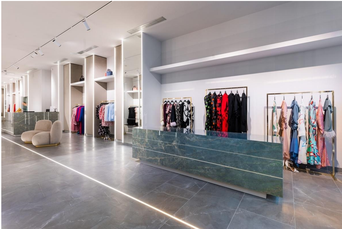
Slika 5. Interijer sa haljinama u trgovini Lei Lou