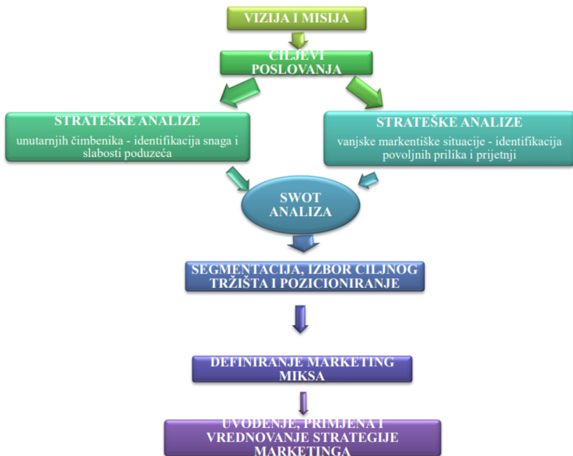
Slika 1. Kreiranje marketinških strategija