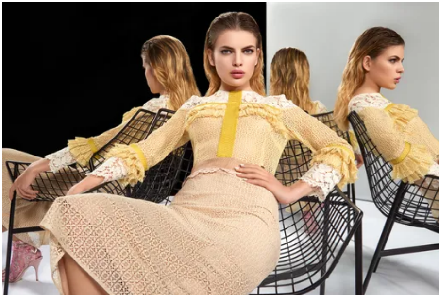
Slika 4. Kampanja proljeće / ljeto 2016. godine