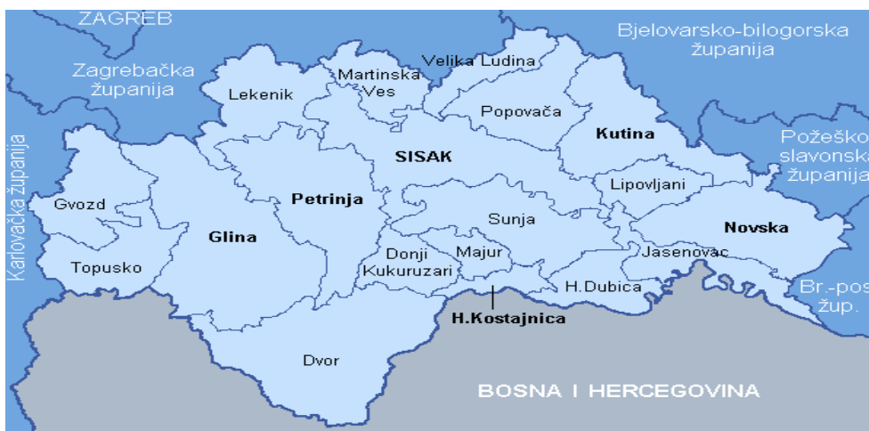
Slika 2. Sisačko-moslavačka županija