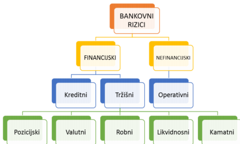
Slika 1. Podjela rizika u bankarskom sektoru

Izvor: izrada autora prema: Kundid, P. (2018) Upravljanje rizicima u bankarskom sustavu. Specijalistički rad. Zagreb: RRIF, str. 20.