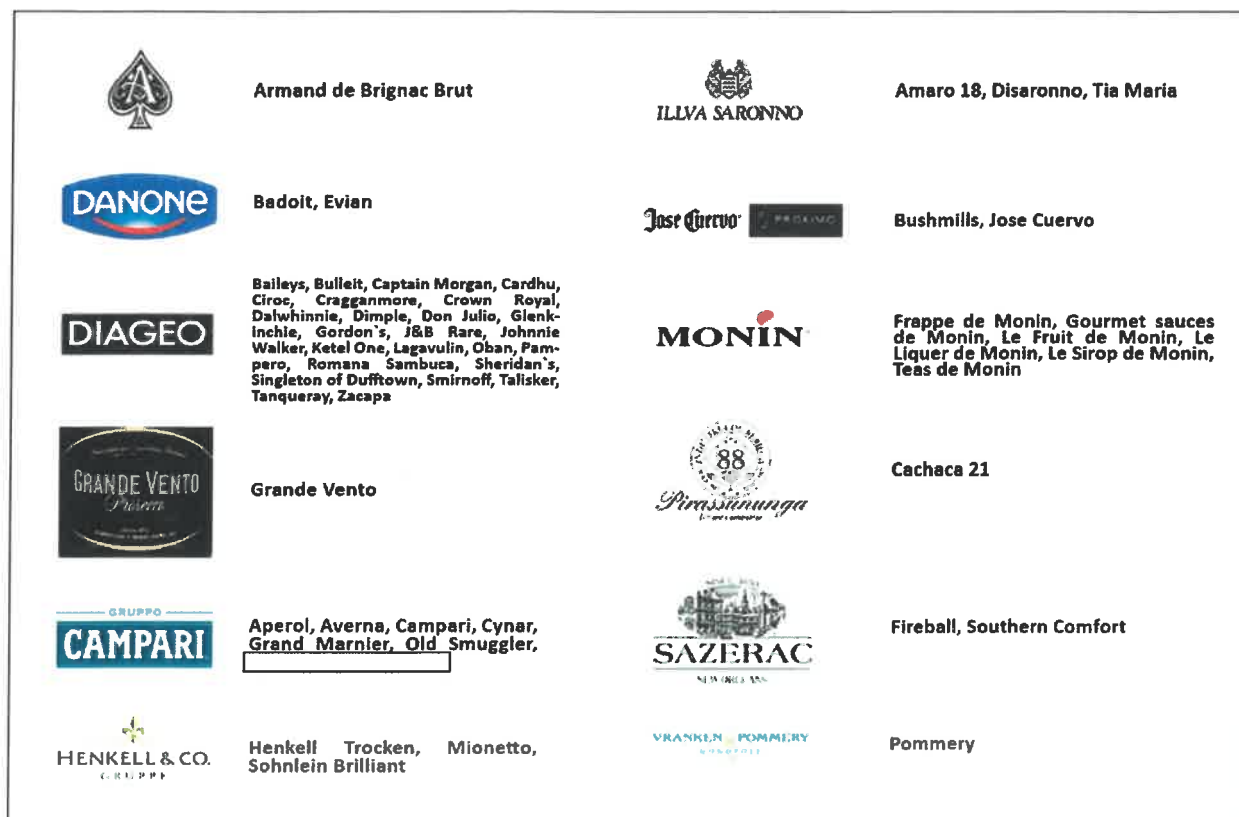
Slika 3.: PPD Croatia portfolio