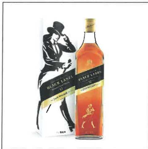
Slika 5.: Jane Walker

DIAGEO marke, između različitih kategorija žestokih alkoholnih pića uključuju i najpoznatiji škotski viski Johnnie Walker. Posljednjih godina poduzeće se najviše fokusira na rast i distribuciju Johnnie Walker Black Labela, škotskog viskija 12 godina starosti, koje označavaju 12 godina odležavanja u bačvama različitih destilerija diljem Škotske. S obzirom da je viski kao kategorija najzastupljeniji među muškom populacijom, 2018. godine DIAGEO je lansirao posebnu, limitiranu ediciju Johnnie Walkera nazvanu Jane Walker.