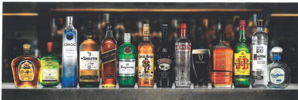
Slika 4.: Pregled DIAGEO portfolija