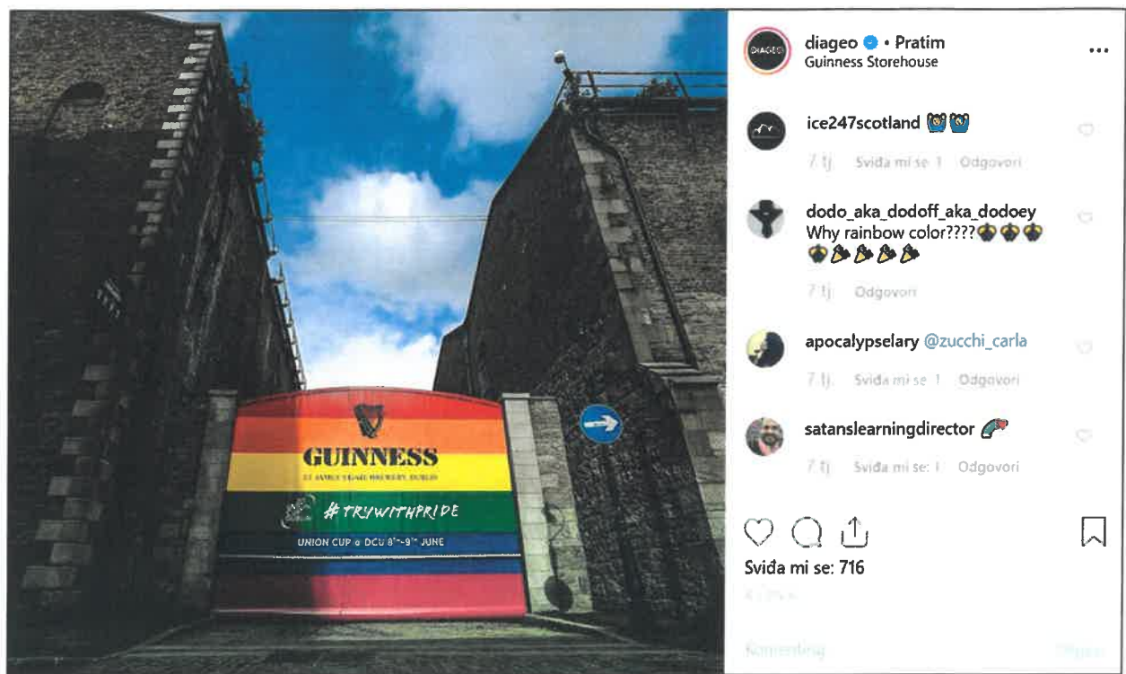
Slika 6.: Vrata Guinness postrojenja