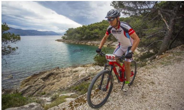
Slika 11. Cross Country biciklizam na otoku Braču