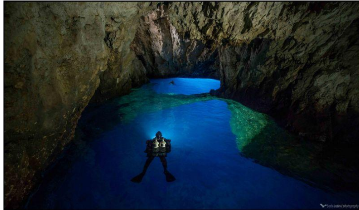
Slika 8. Modra špilja