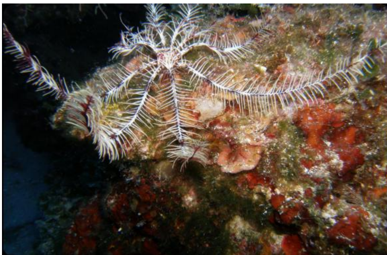
Slika 6. Sredozemna dlakavica