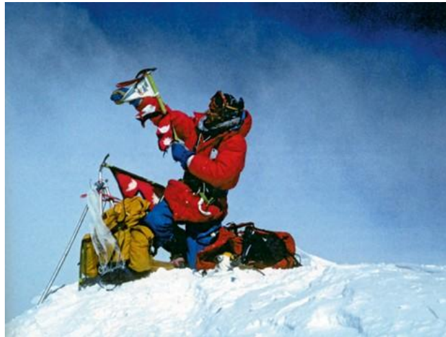
Slika 1. Stipe Božić na vrhu Mount Everesta