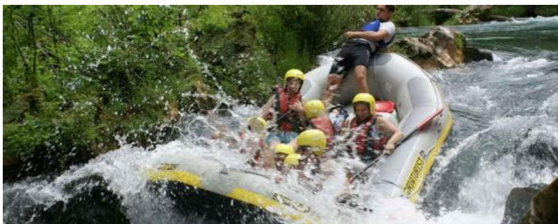
Slika 13. Rafting na Cetini