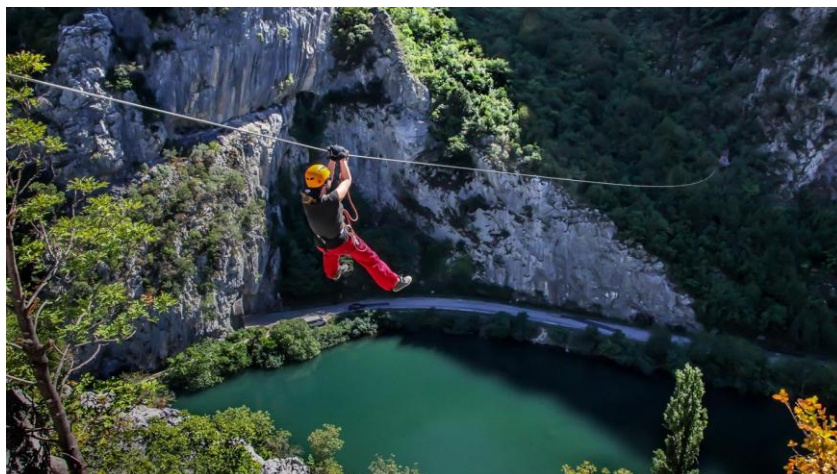
Slika 14. Zipline na Cetini (kod Omiša)