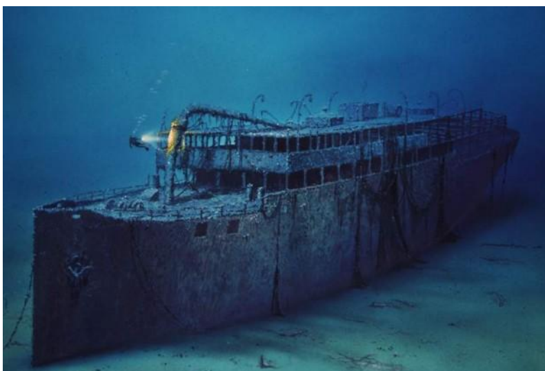
Slika 7. Olupina putničkoga broda Baron Gautsch