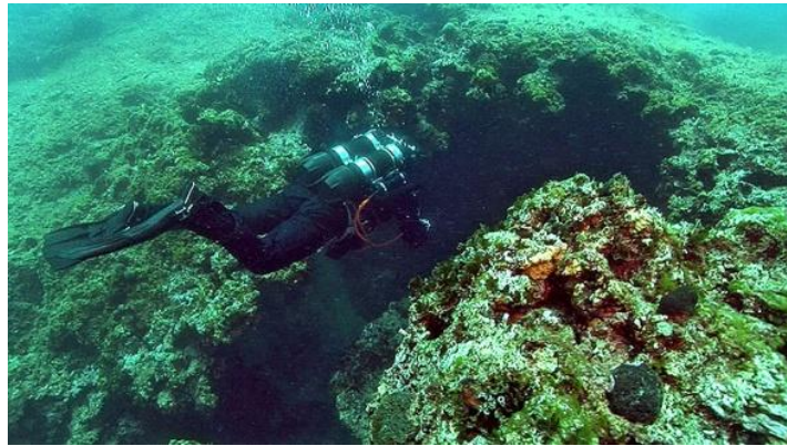
Slika 9. Ulaz u Katedralu