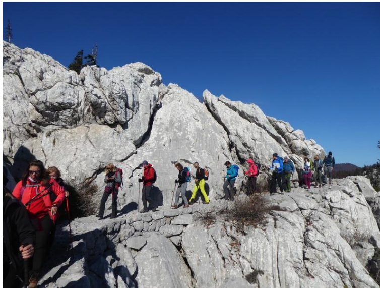
Slika 3. Premužićeva staza