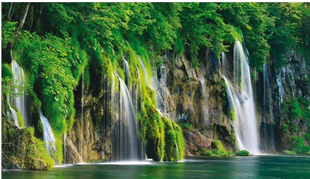
Slika 15. Plitvička jezera

Ovo su neke od najpoznatijih destinacija u Lici: Plitvička jezera, rijeka Gacka- Otočac, planina Velebit, Gospić, Perušić, Lovinac, Brinje, Udbina, Senj, Karlobag i otok Pag.