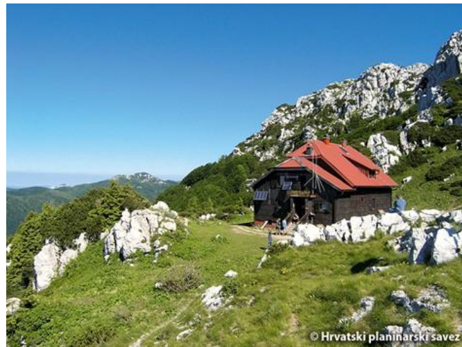
Slika 5. Nacionalni park Risnjak (1418m) i planinarski dom Schlosserov dom