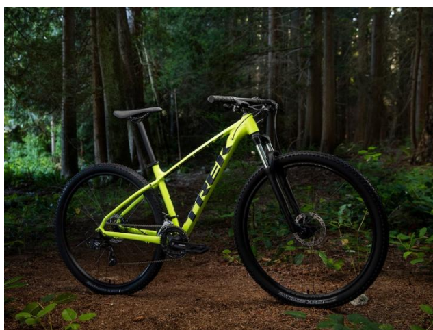
Slika 10. Primjer brdskog bicikla