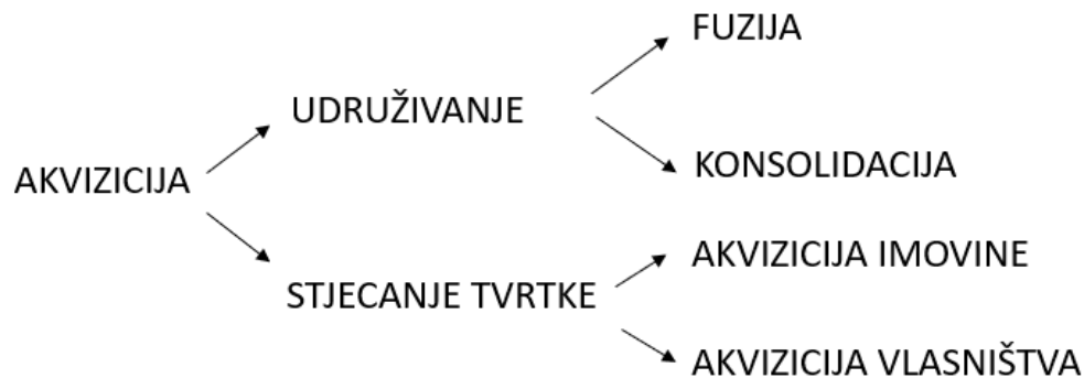
Slika 1. Oblici akvizicije