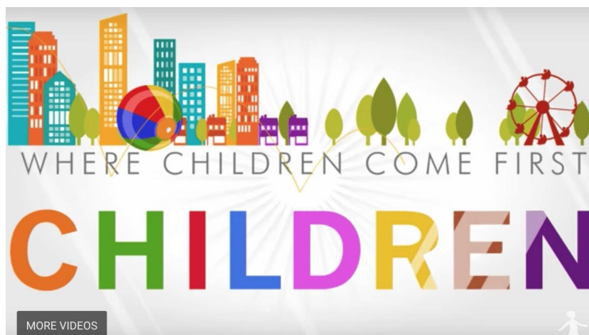
Slika 2. Svijet Helen Doron

Izvor: Helen Doron English. Dostupno na: https://helendoron.hr/ [24.09.2020.]