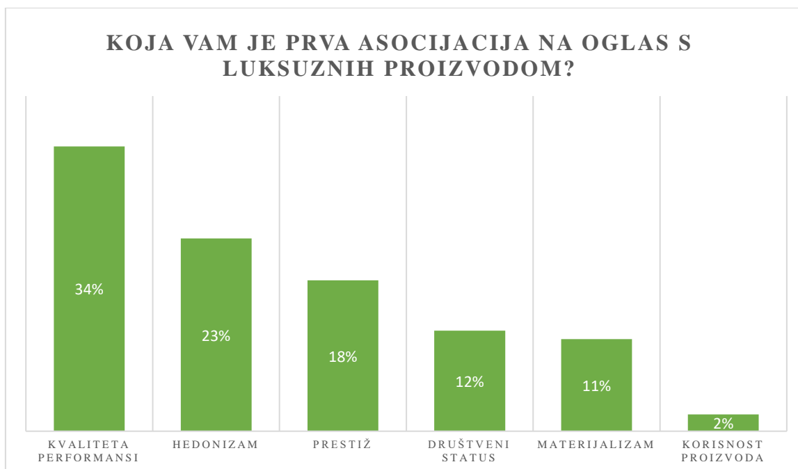
Slika 4: Asocijacija na oglas s luksuznim proizvodom

Zanimljivo je kako je najvećem broju ispitanika prva asocijacija na oglas s luksuznim proizvodima kvaliteta performansi (34%), a zatim hedonizam (23%), prestiž (18%), društveni