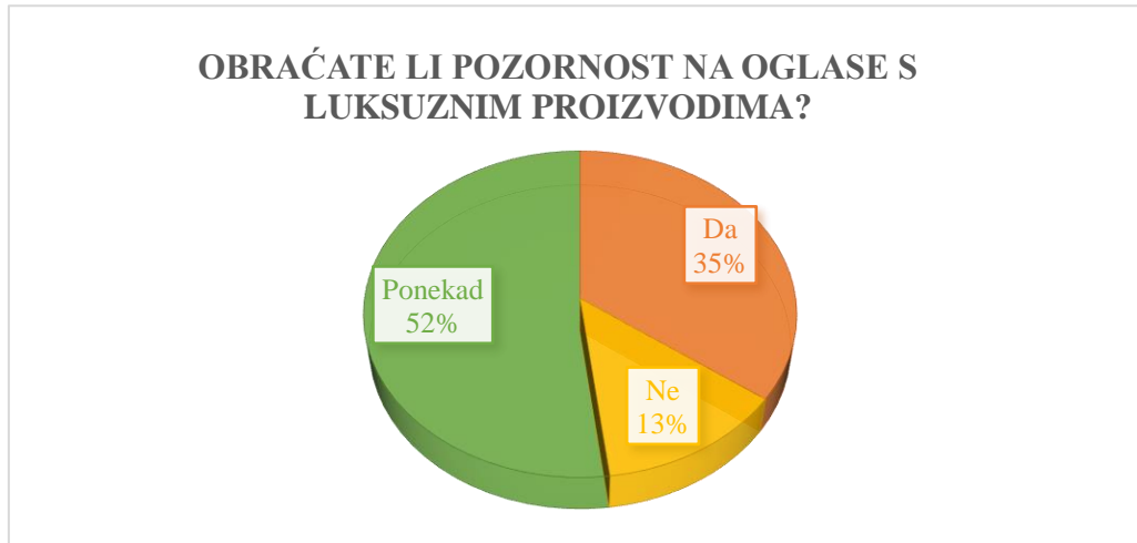
Slika 1: Pozornost prema oglasima s luksuznim proizvodima

Također, na grafikonu je vidljivo kako se u slučaju oglasa s luksuznim proizvodom postotak ispitanika, koji obraća pozornost na takav specifičan oglas, povećao za 2% , ali se i povećao postotak onih koji uopće ne obraćaju pozornost na oglase s luksuznim proizvodima (13%). No, zanimljivo je kako je od tih trinaest ispitanika, sedmero njih kupilo luksuzni proizvod više od jednog puta u životu, što najvjerojatnije znači da se radi o potrošačima koji su sigurni u vlastitu procjenu kvalitete proizvoda, vlastiti odabir marke te su upoznati sa svojim željama i potrebama, ili o potrošačima koji kupuju luksuzne proizvode na temelju preporuke prijatelja. Nadalje, i dalje je najviše ispitanika koji ponekad obraćaju pozornost na oglase s luksuznim proizvodima, točnije 52% ispitanika.