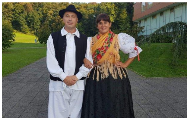
Slika 3: Međimurska narodna nošnja