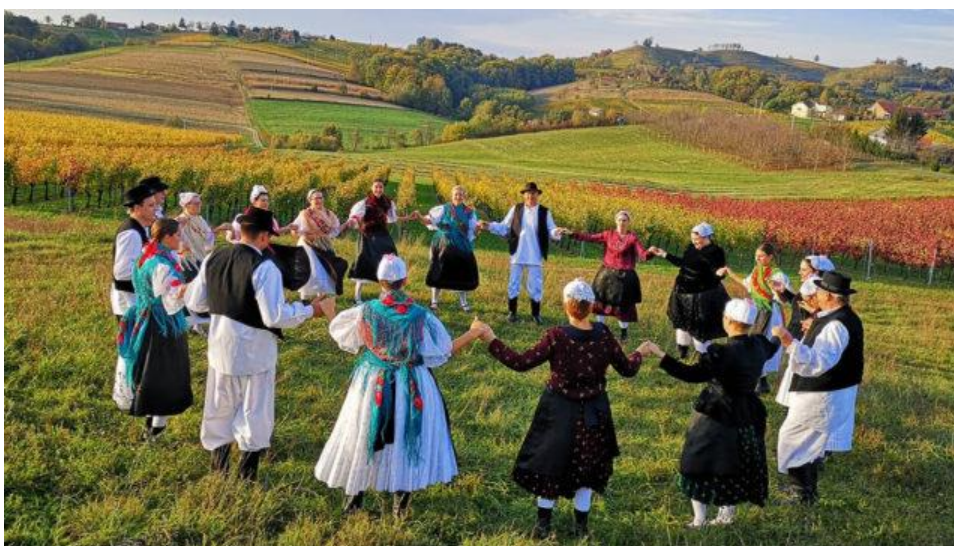
Slika 2: Kulturno umjetnička udruga "Veseli Međimurci" - međimursko kolo