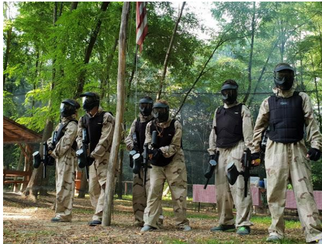
Slika 4: Paintball u Accredu centru