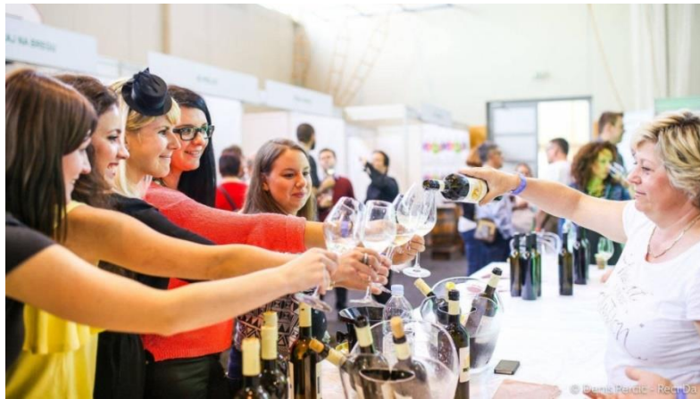
Slika 5: Urbanovo, najpoznatija manifestacija Udruge "Hortus Croatiae"