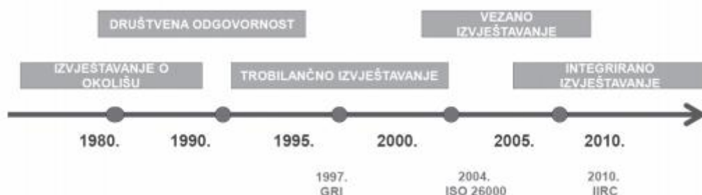
Slika 1 Razvoj nefinancijskog izvještavanja