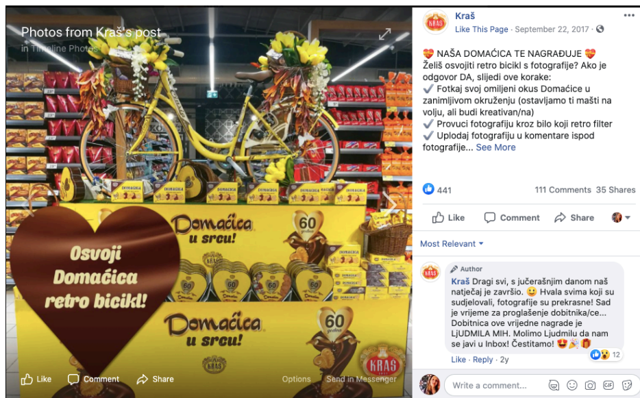
Slika 25. Objava nagradnog natječaja Domaćice na Facebooku