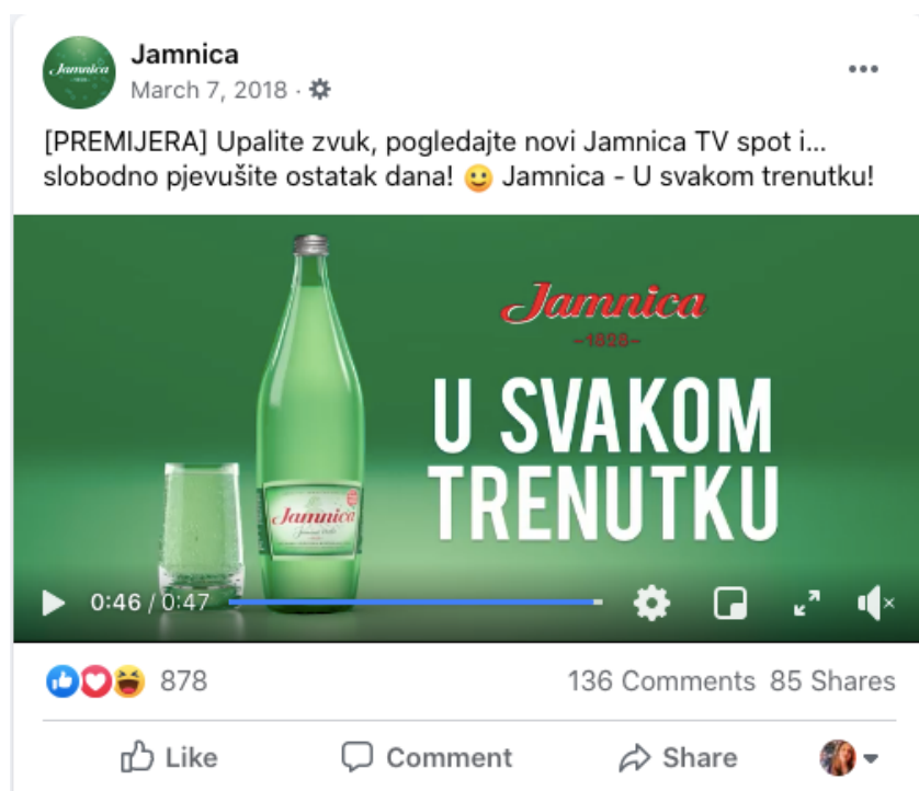
Slika 12. "U svakom trenutku" TV spot objava