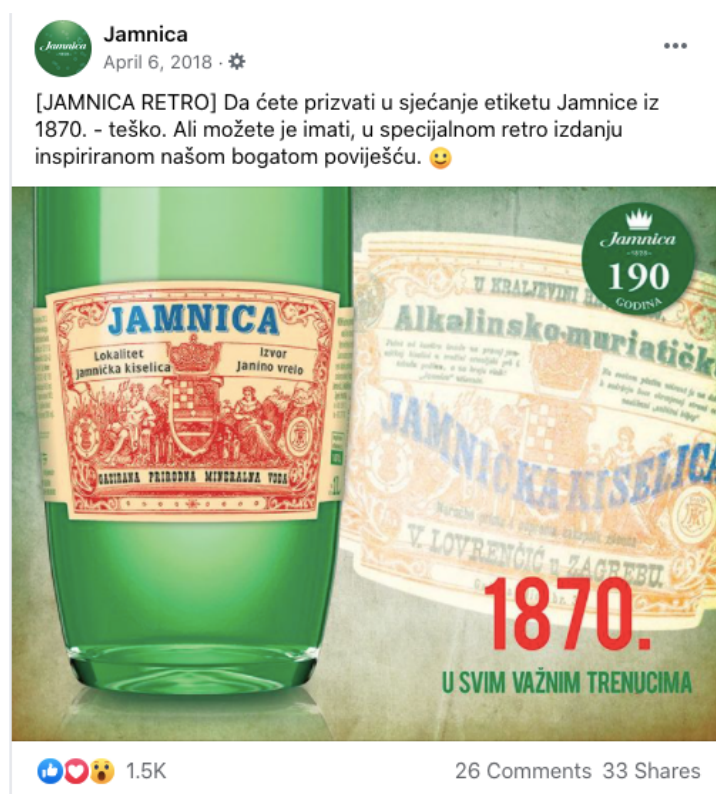
Slika 14. Objava retro etiketa iz 1870. godine