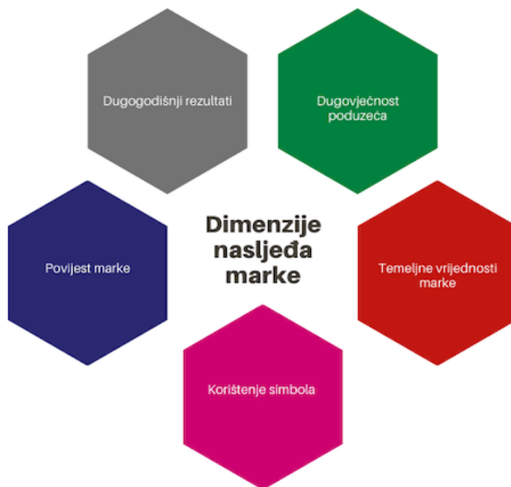
Slika 1. Dimenzije nasljeđa marke