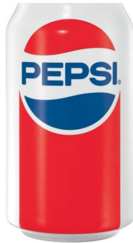
Slika 8. Retro ambalaža Pepsi Cole