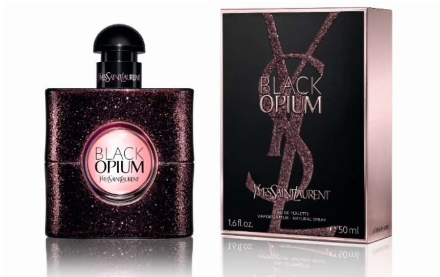
Slika 4. YSL Black Opium Eau de Toilette – prikaz primjerene luksuzne ambalaže za odrasle osobe