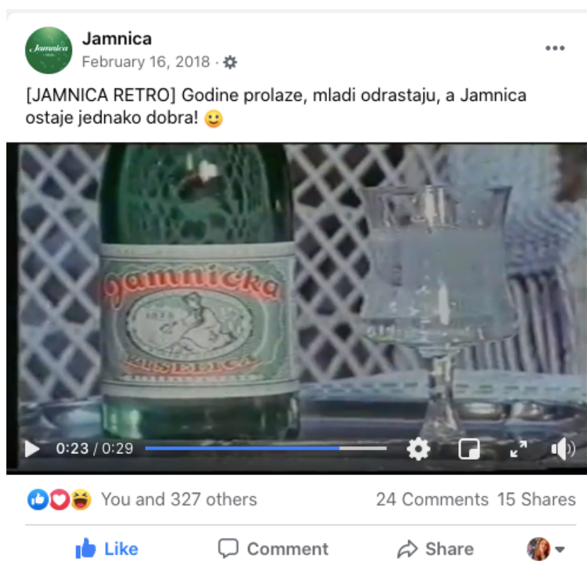
Slika 11. Jamnica retro TV spot objava - Facebook