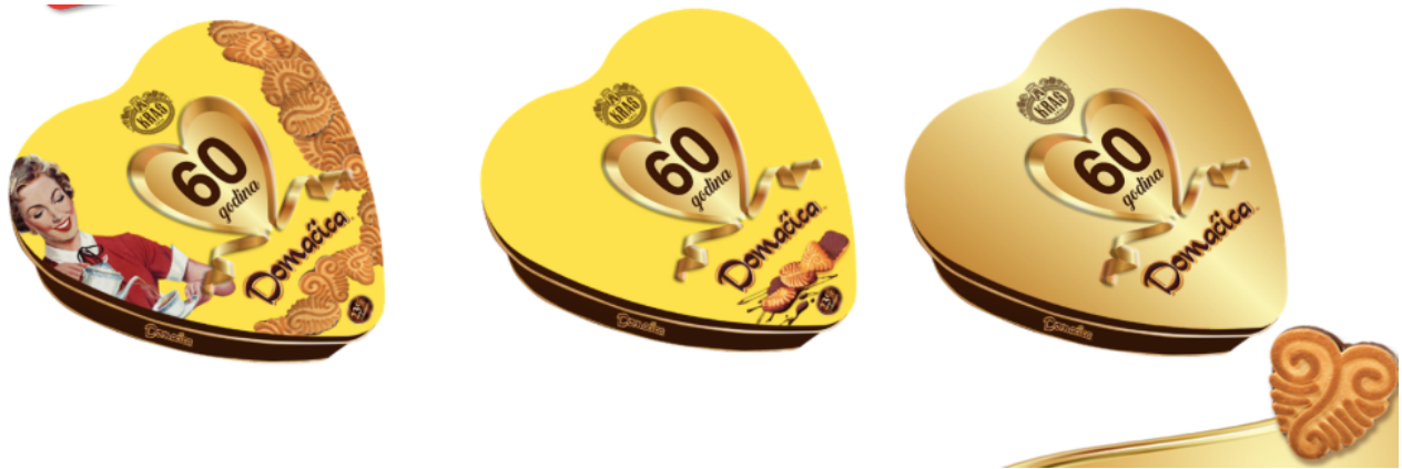
Slika 24. Limena retro ambalaža Domaćica keksa