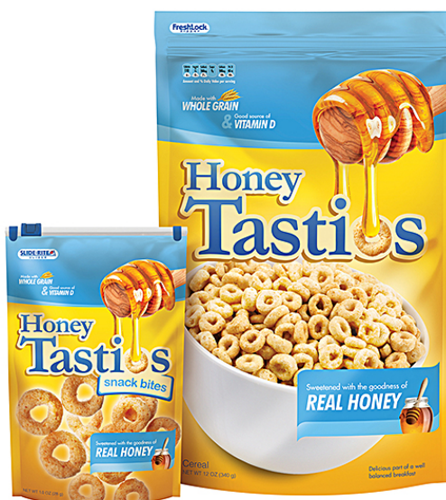
Slika 5. Ambalaža Honey Tastios pahuljica