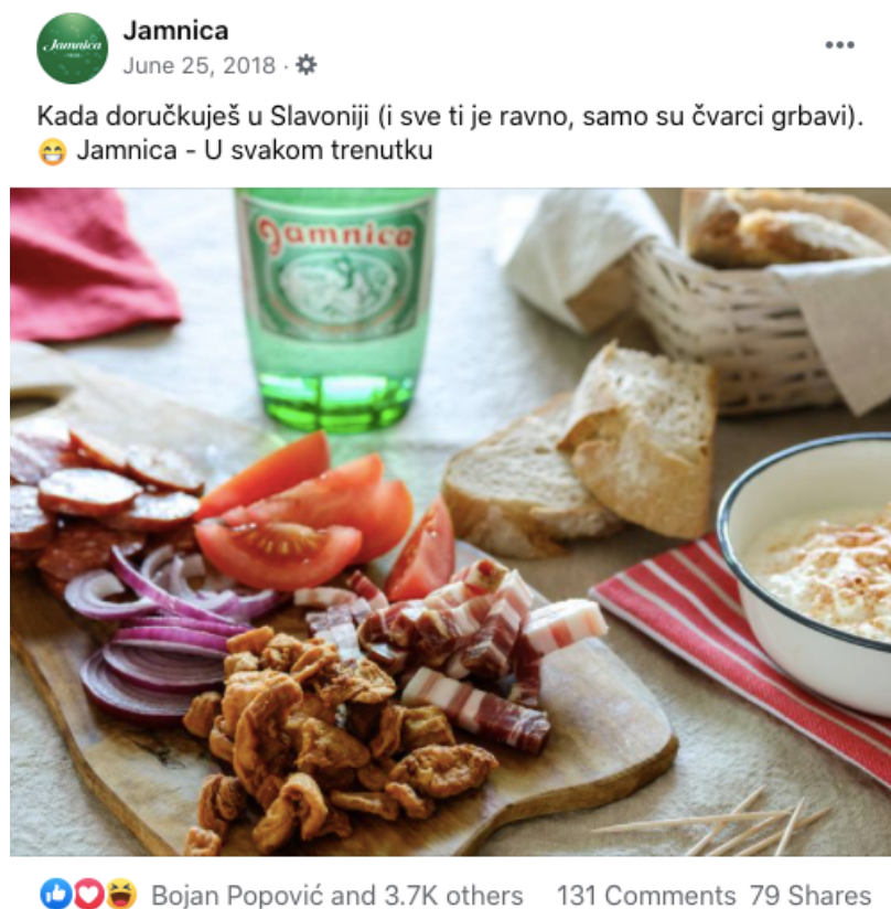
Slika 21. Objava retro izdanja Jamnice u modernom okruženju

Izvor: Facebook ( https://www.facebook.com/Jamnica.voda/posts/1950363898315617 )