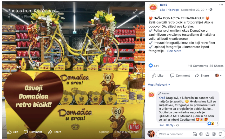
Slika 25. Objava nagradnog natječaja Domaćice na Facebooku