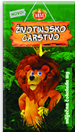
Slika 3. Kraš čokoladica Životinjsko carstvo – prikaz primjerene ambalaže za djecu