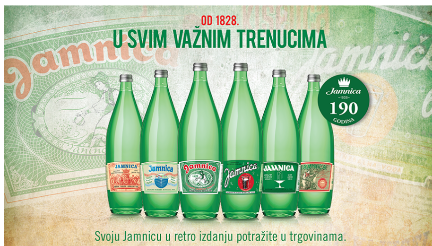
Slika 9. Retro ambalaže Jamnica mineralne vode