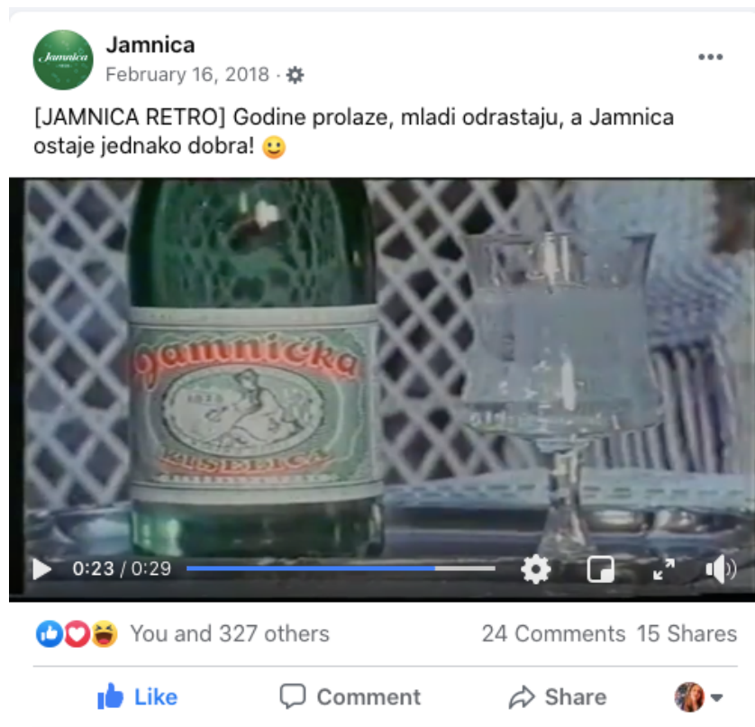
Slika 11. Jamnica retro TV spot objava - Facebook