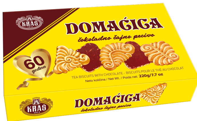
Slika 23. Retro ambalaža Domaćica keksa

U ožujku 2017. godine u prodaju je puštena je Domaćica s retro ambalažom. Originala ambalaža od 300 grama lansirana je 28. veljače.