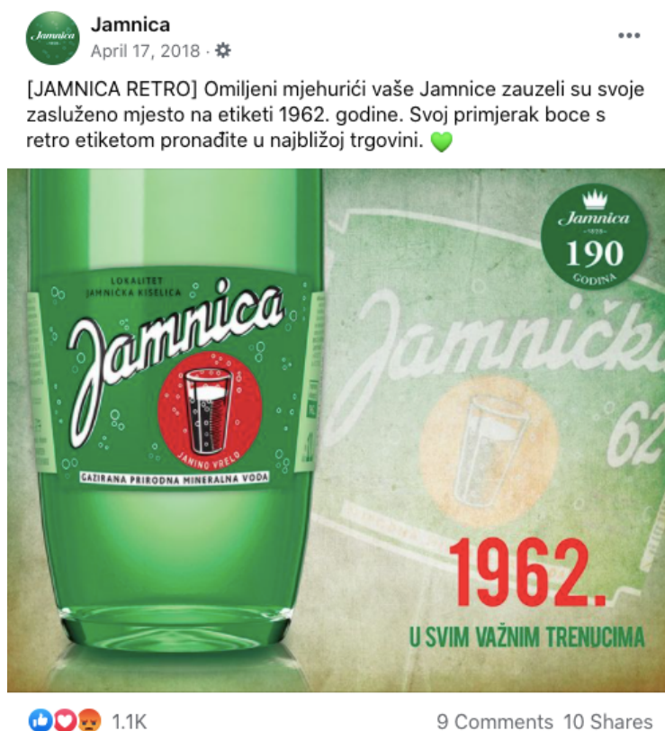
Slika 18. Objava retro etikete iz 1962. godine