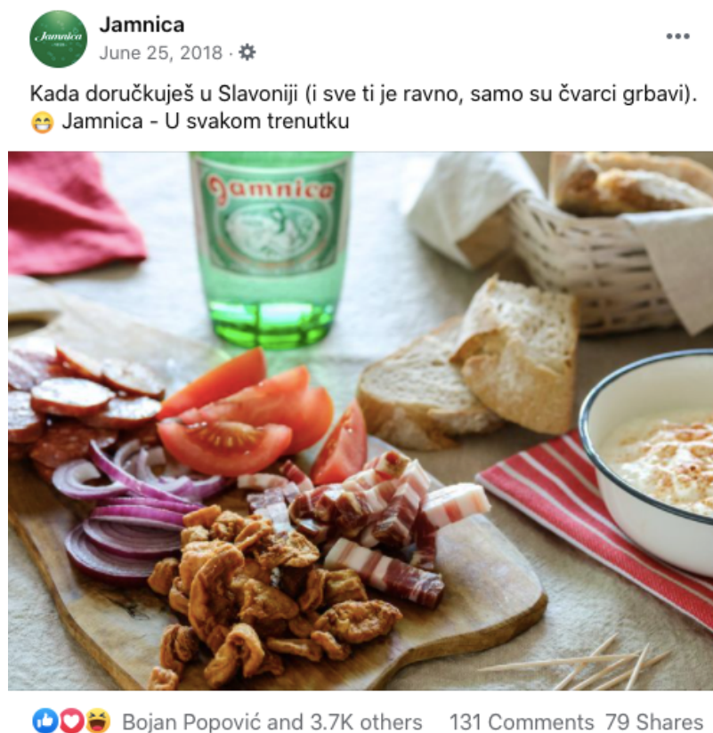
Slika 21. Objava retro izdanja Jamnice u modernom okruženju