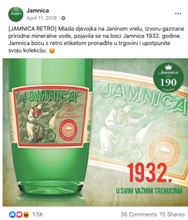
Slika 16. Objava retro etikete iz 1932. godine