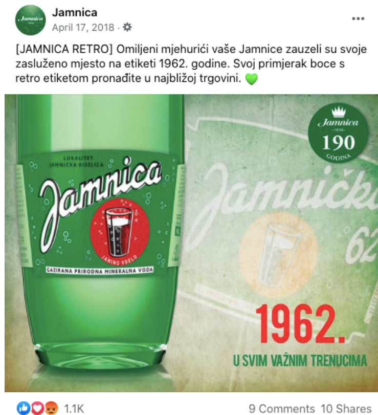
Slika 18. Objava retro etikete iz 1962. godine