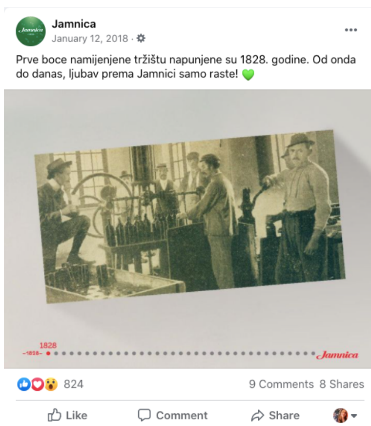
Slika 10. Jamnica retro Facebook objava