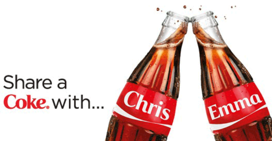
Slika 6. Coca-Cola "Share a coke" ambalaža