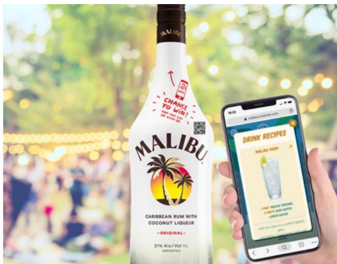
Slika 7. Malibu Rum pametna ambalaža