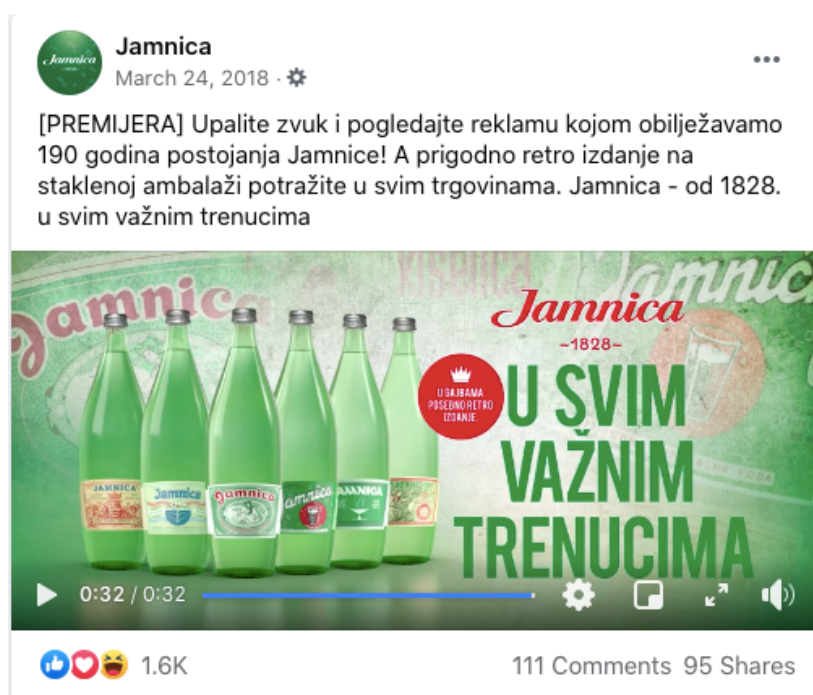
Slika 13. Jamnica "U svim važnim trenucima" objava kampanje