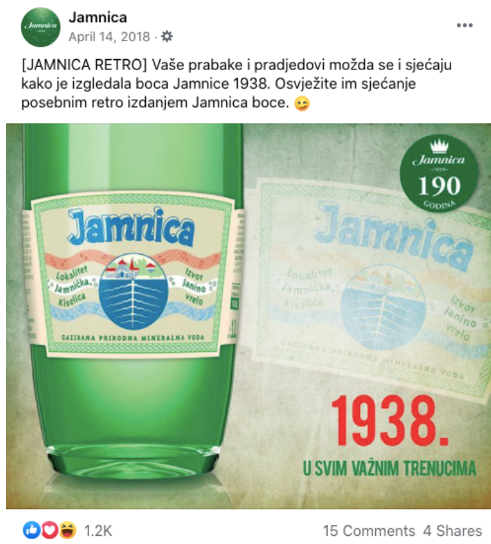
Slika 17. Objava retro etikete iz 1938. godine