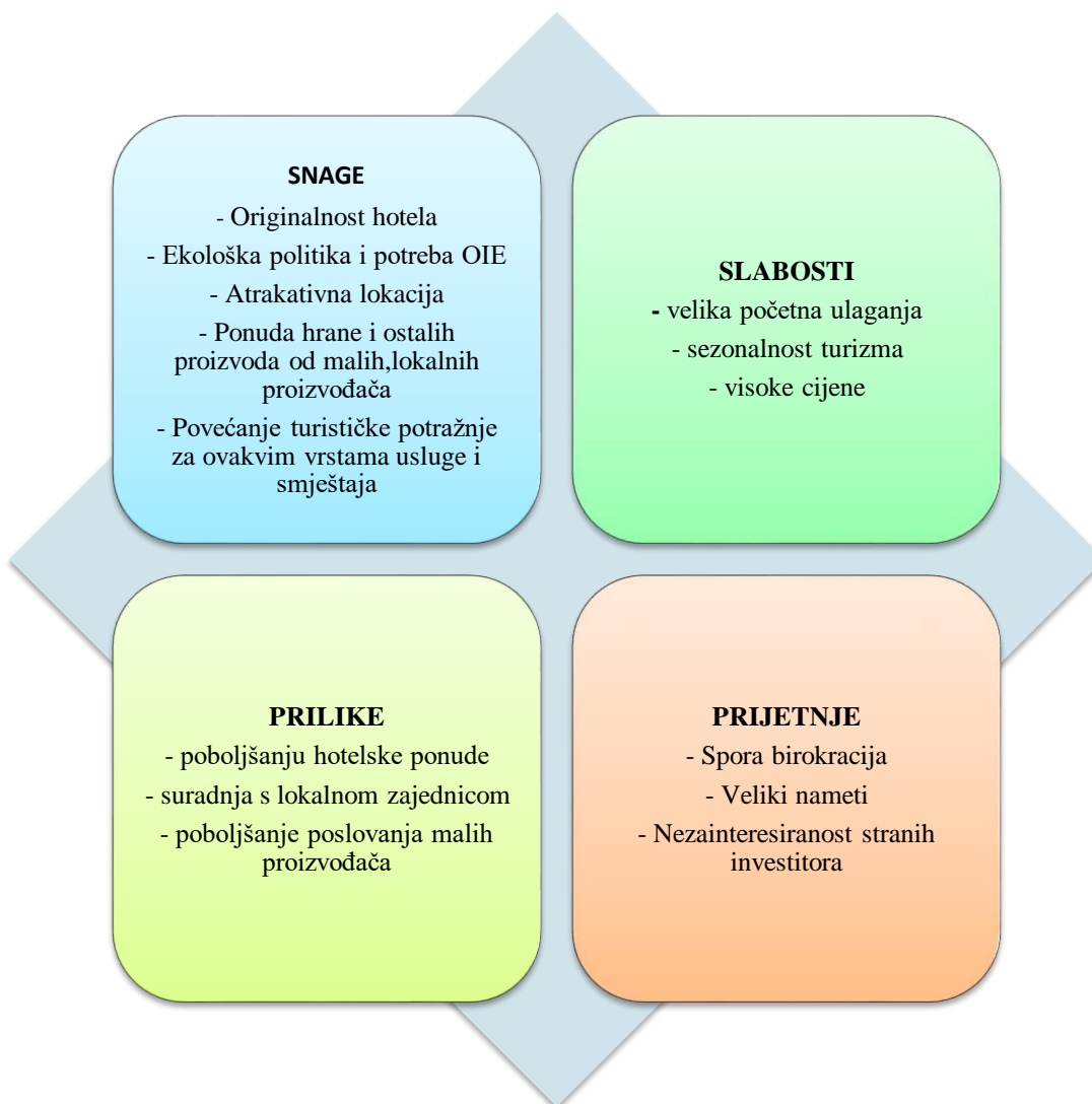
Slika 2. SWOT analiza eko hotela