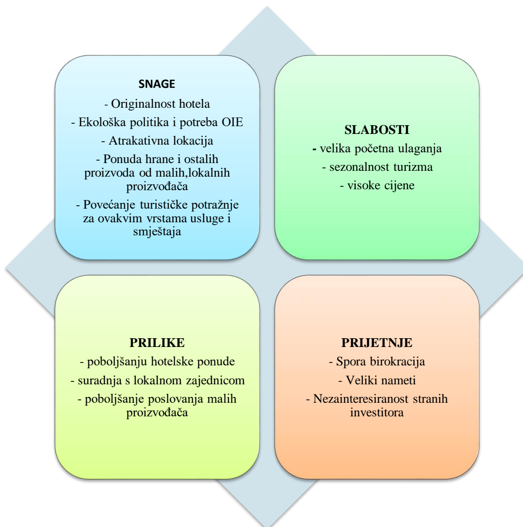
Slika 2. SWOT analiza eko hotela