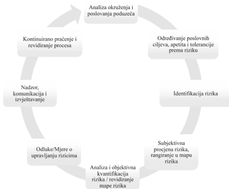
Slika 3 Proces integriranog upravljanja rizicima