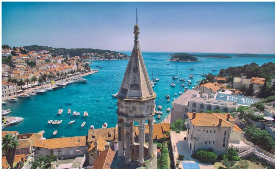
Slika 7. Otok Hvar panorama