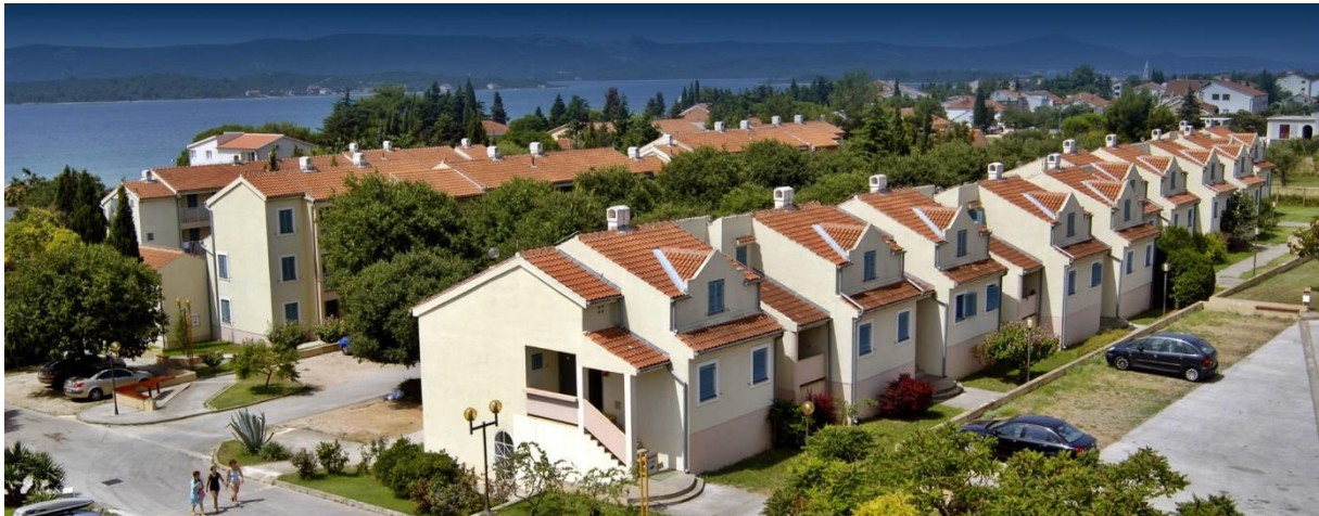
Slika 6. Turističko naselje, Sv. Filip i Jakov