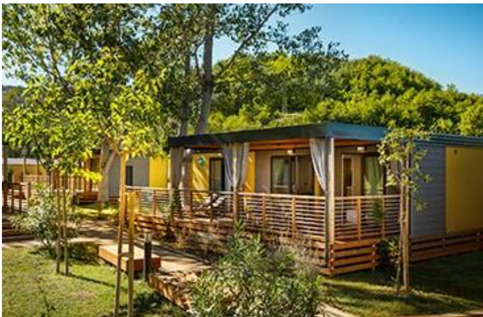
Slika 7. Kamp-jedinica, San Marino, Rab