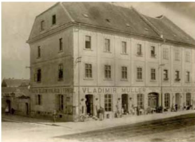
Slika 11. Kuća Müller