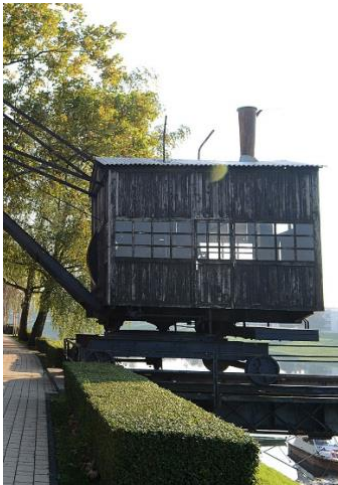
Slika 2. Granik-prva parna dizalica