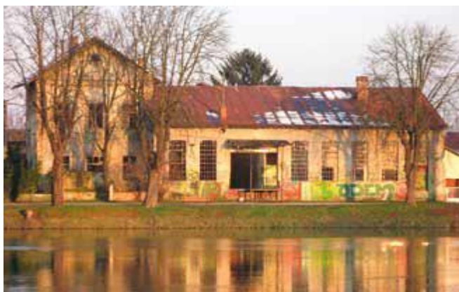
Slika 7. sadašnje stanje Gradske munjare