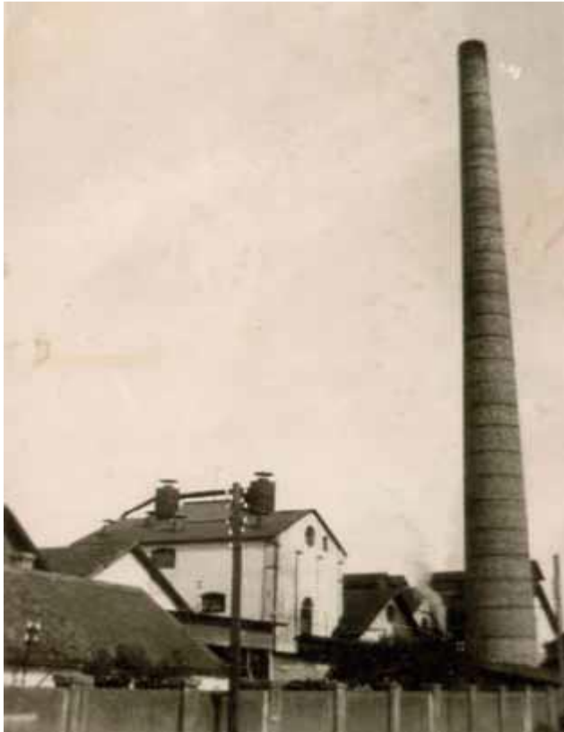
Slika 8. Tvornica tanina