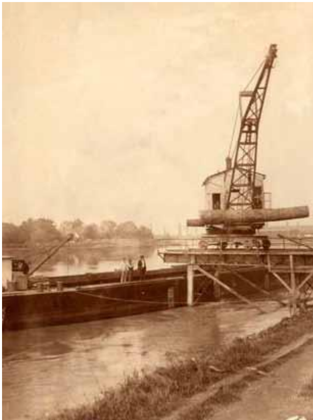
Slika 10. Parno dizalo na Kupu