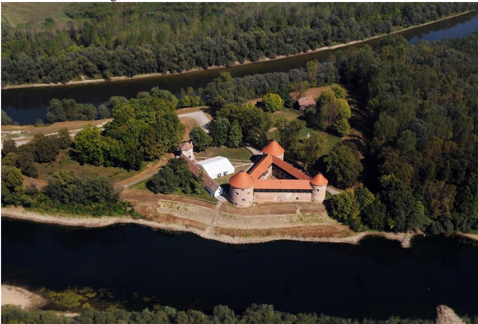
Slika 3. utvrda Stari grad