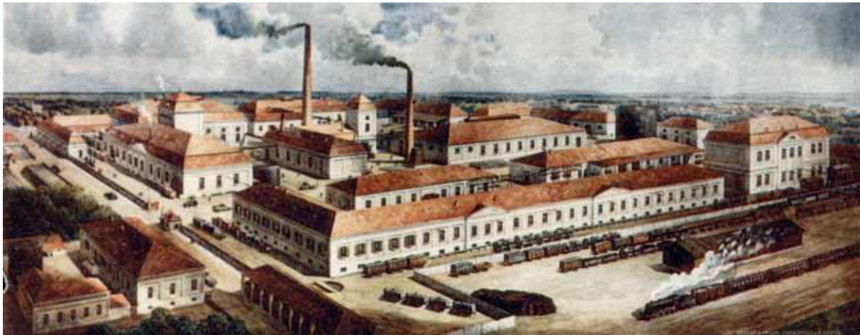
Slika 9. Reklamna fotografija prve tvornice P. Teslića