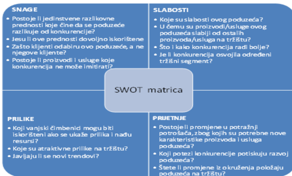
Slika 2: SWOT matrica

Izvor: Miloš Sprčić, D. (2013) Upravljanje rizicima – temeljni koncepti, strategija i instrumenti . Zagreb: Sinergija