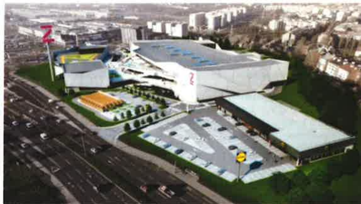
Slika 1. Prikaz Z Centra u Španškom