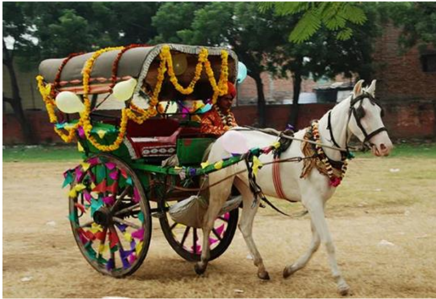
Slika 8: Tangah