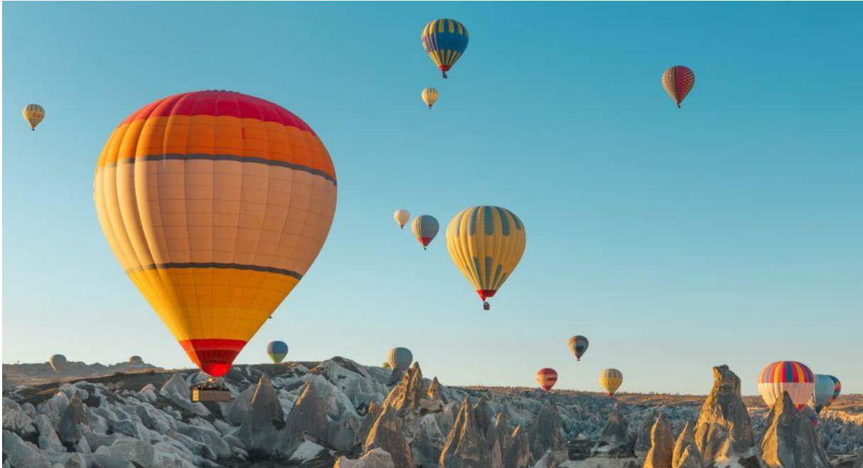
Slika 21: Balon na vrući zrak