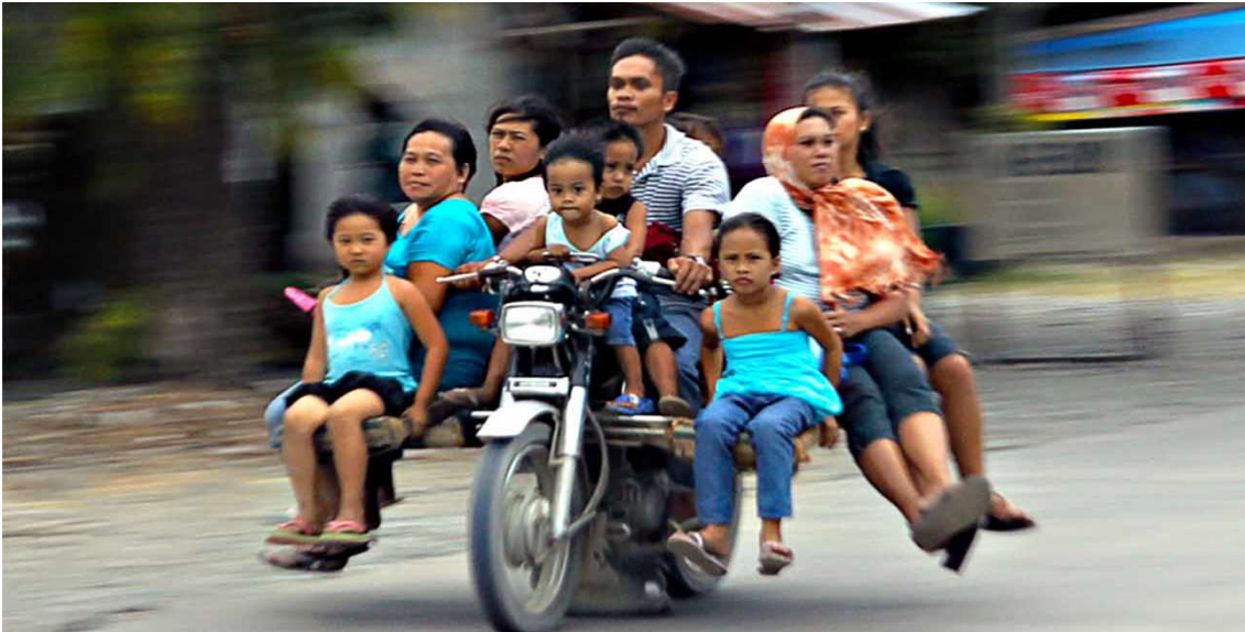
Slika 10: Habal Habal