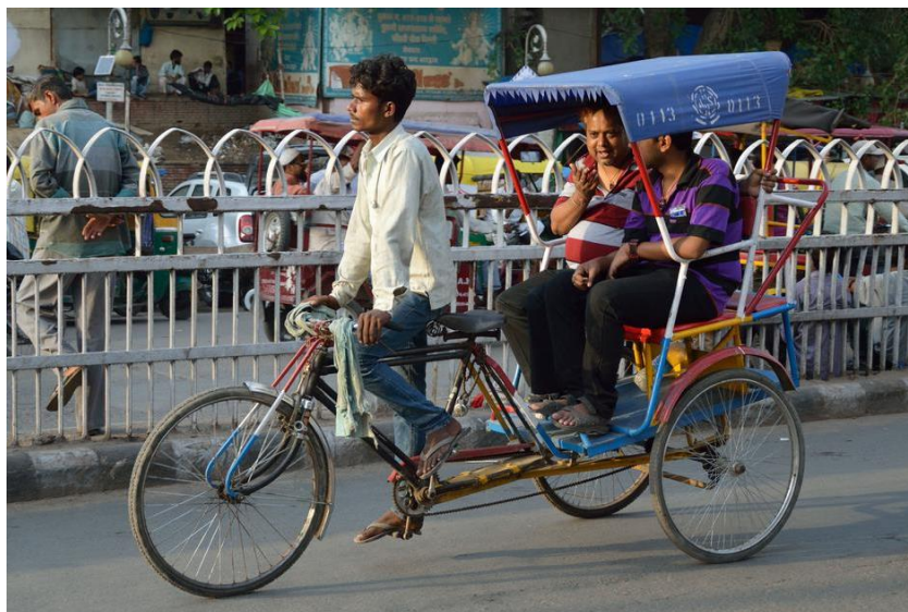
Slika 7: Rikša 2