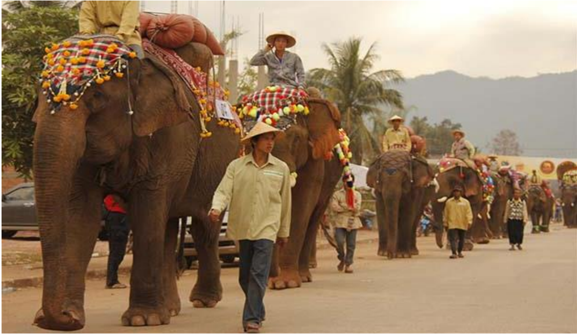
Slika 12: Slonovi