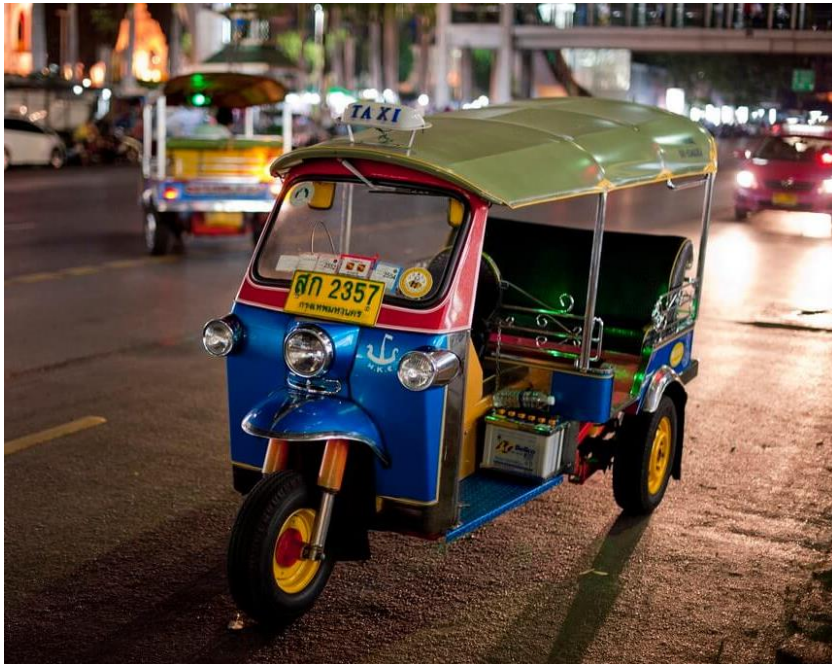
Slika 14: Tuk Tuk