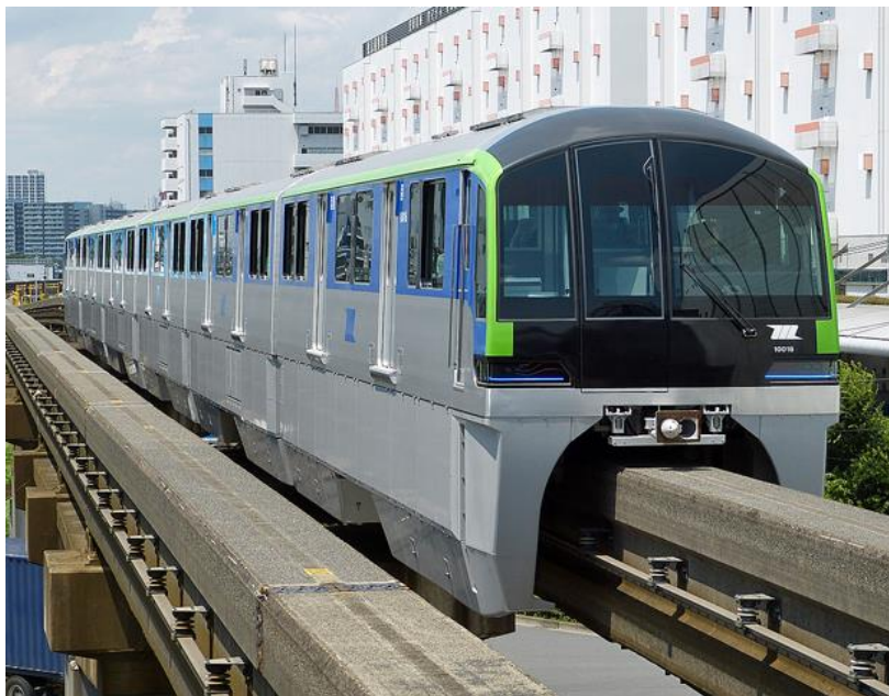
Slika 18: Monorail 2