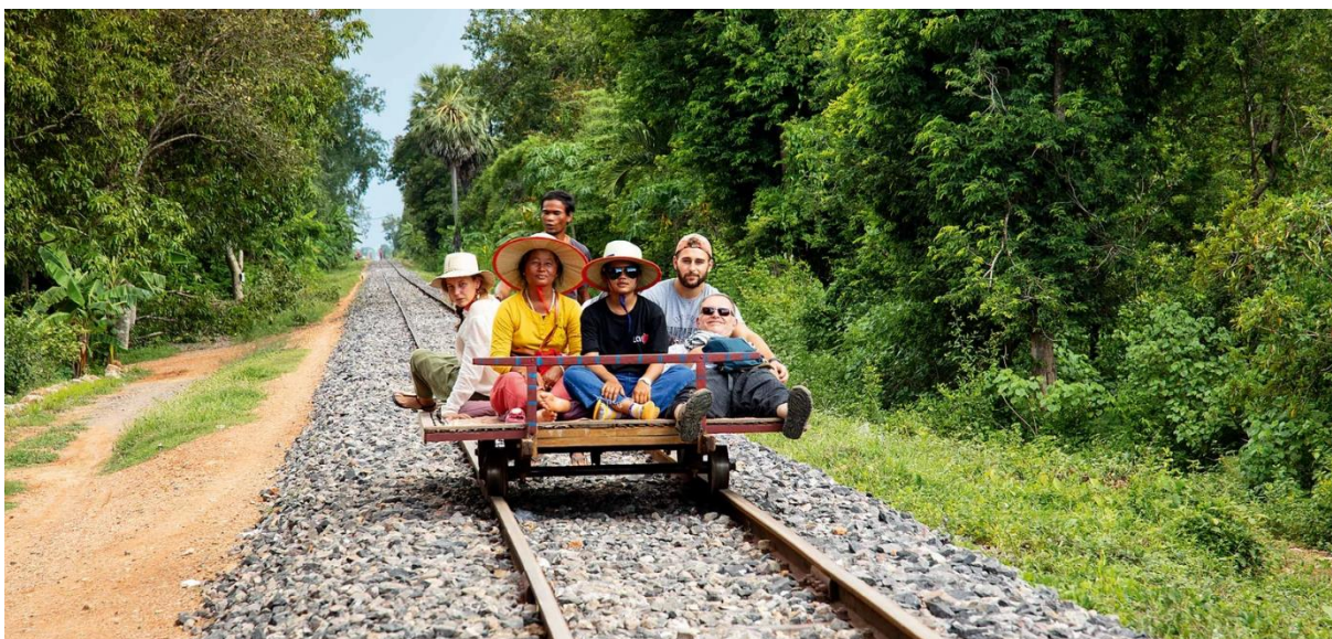
Slika 15: Bamboo Vlak