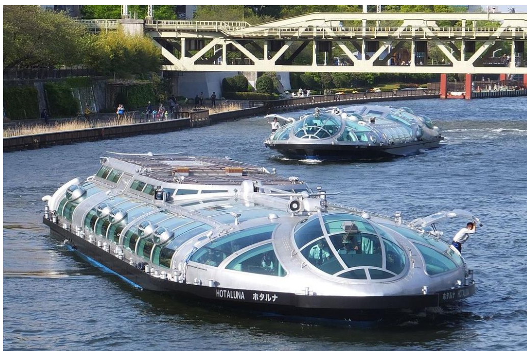
Slika 16: Vodeni bus