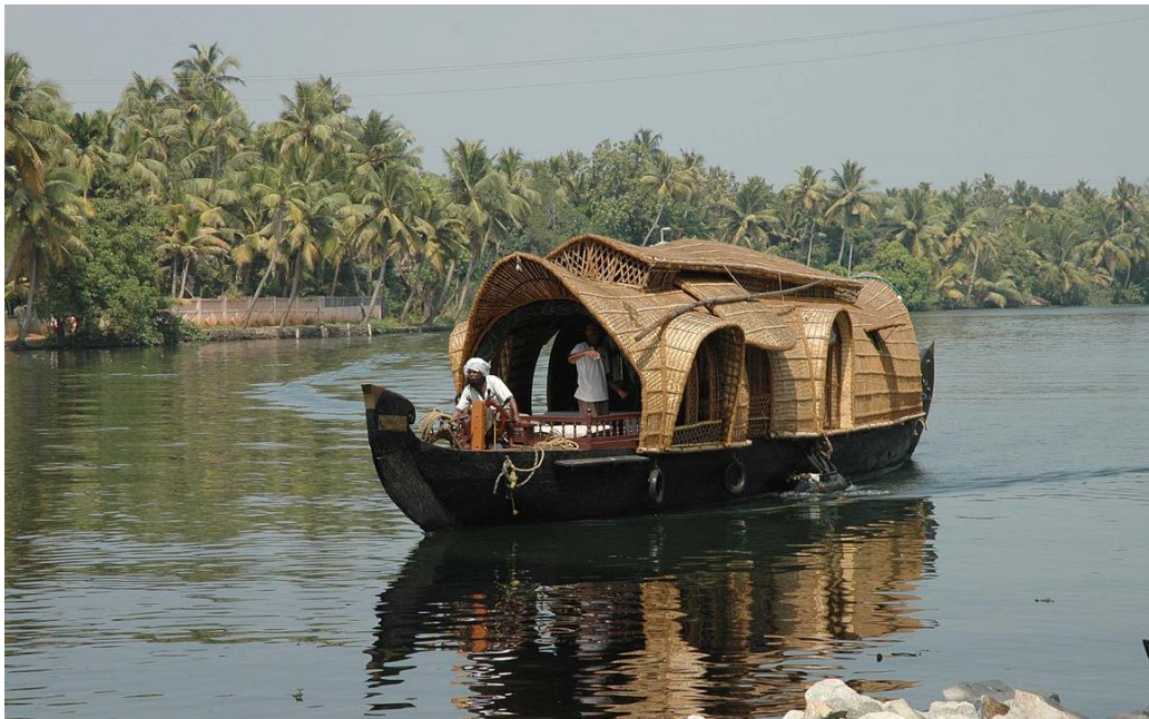
Slika 3: Houseboat