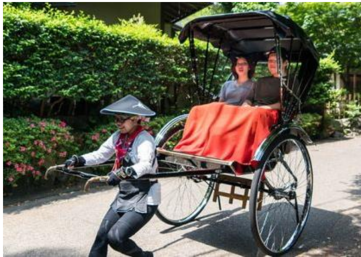
Slika 6: Rikša