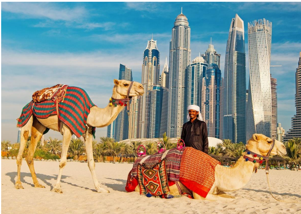
Slika 22: Deve