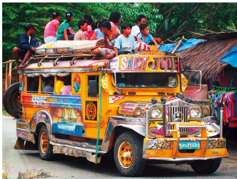
Slika 11: Jeepney