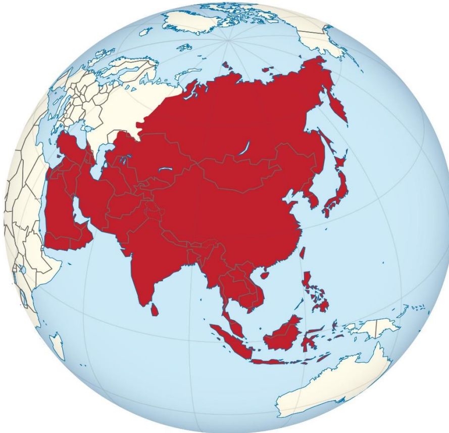
Slika 1: Makrolokacija Azije