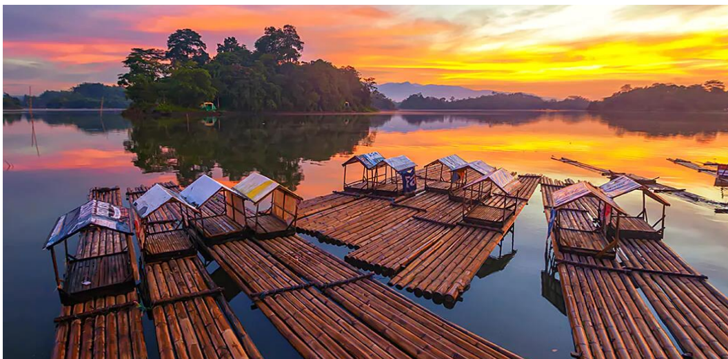
Slika 9: Rakit