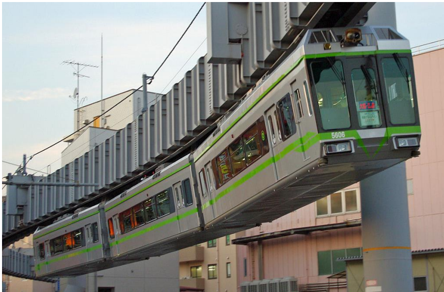
Slika 17: Monorail