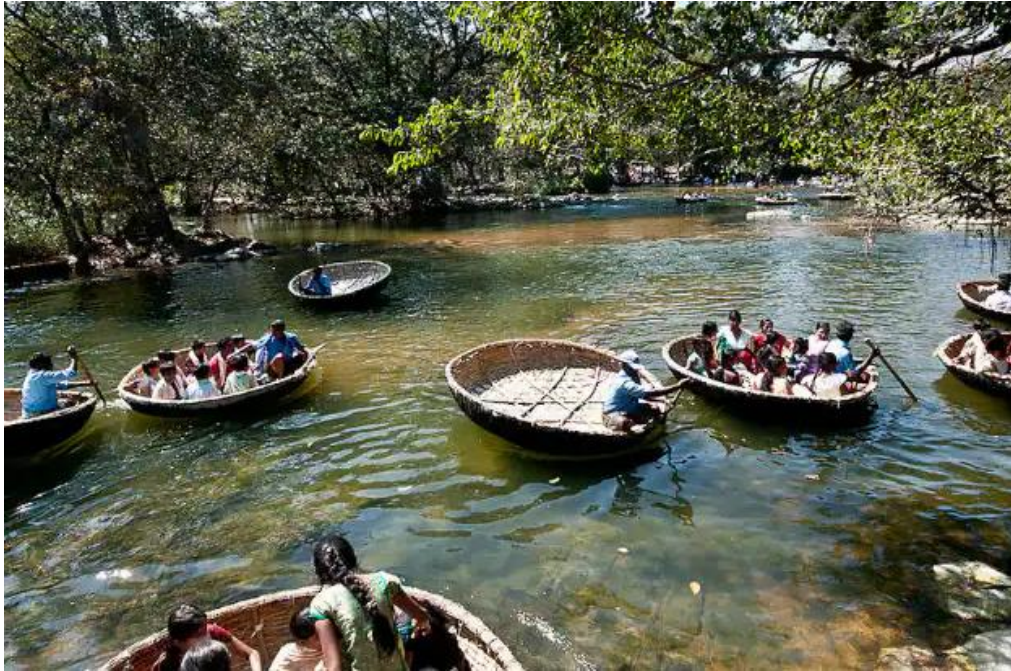
Slika 4: Coracle