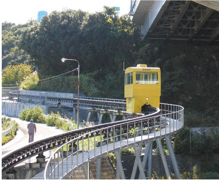
Slika 19: Monorail 3