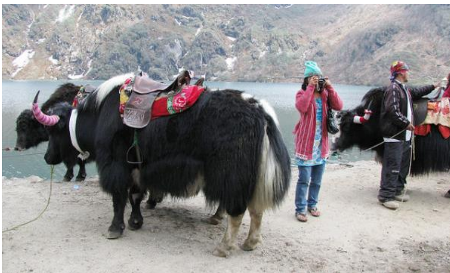
Slika 5: Yak