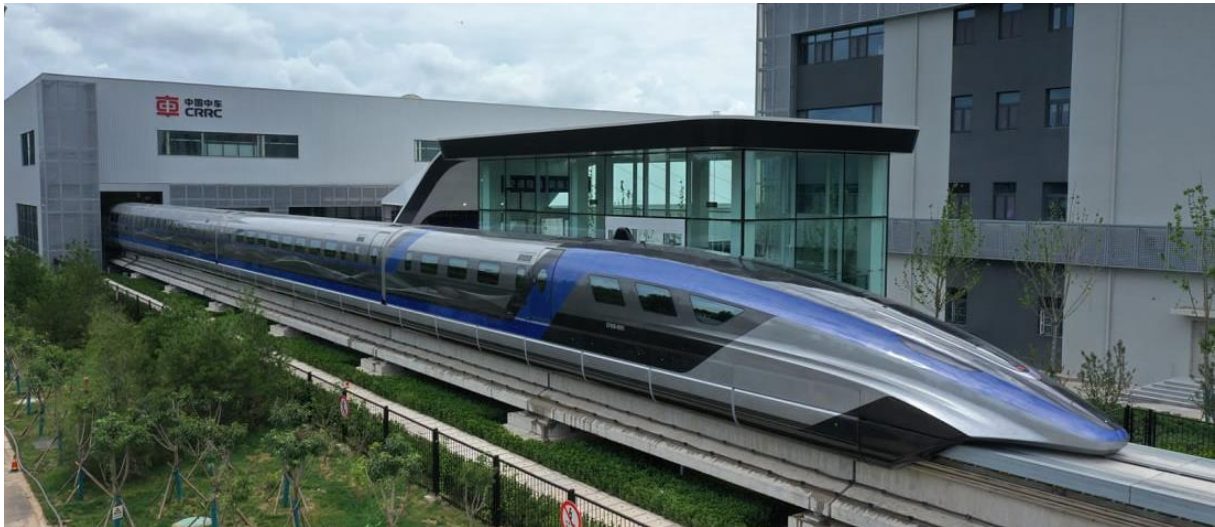
Slika 20: Maglev vlak