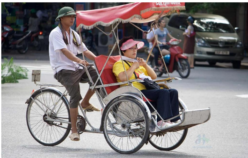
Slika 13: Cyclo