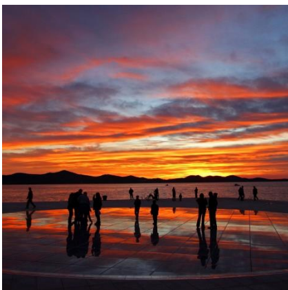
Slika 5. Pozdrav Suncu u Zadru

Pozdrav Suncu turistička je atrakcija i simbol je grada Zadra. Iako je jedna od najpoznatijih turističkih atrakcija grada i mjesto okupljanja mnogobrojnih turista osim prvog zadivljujućeg efekta ne daje neku vrijednost koju bismo pamtili osim toga prvog prizora, no kada bi se samostalno održavao to financijski ne bi bilo izvedivo i zbog toga je potrebno njegovo financiranje iz godine u godinu i baš zato ovu predivnu inovaciju današnjega marketinga su autori nazvali „Pozdravi Suncem“. 15