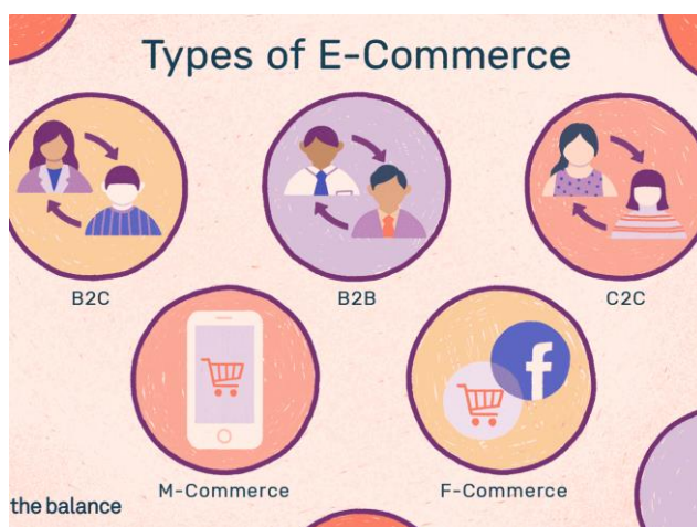
Slika 11. Tipovi e-trgovine