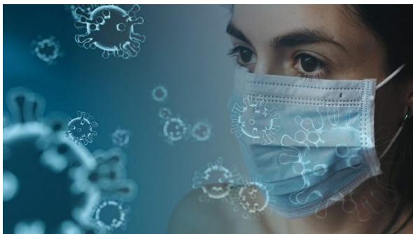
Slika 7. Pandemija koronavirusa