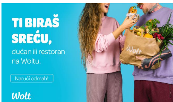
Slika 1. Prikaz display oglasa