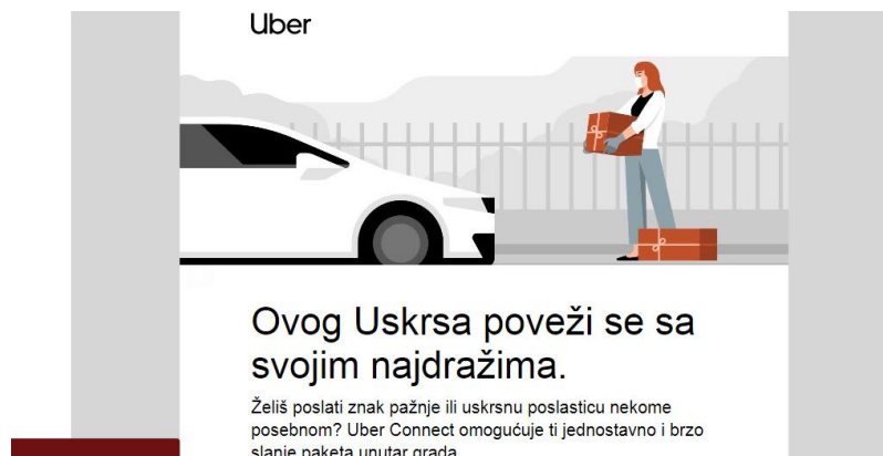
Slika 2. Prikaz e-mail oglasa