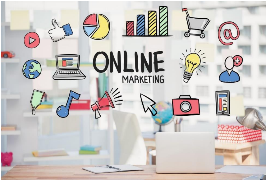
Slika 10. Oglašavanje u digitalnom marketingu