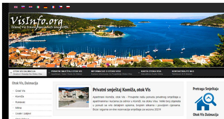
Slika 6. Službena stranica grada Visa