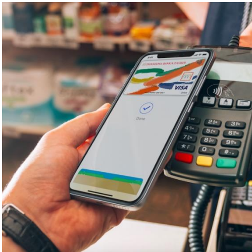
Slika 9. Beskontaktno plaćanje mobitelom