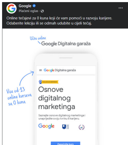
Slika 3. Prikaz Facebook oglasa