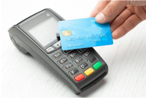
Slika 8. Beskontaktno plaćanje karticom