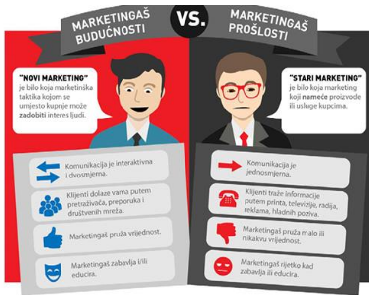
Slika 4. Usporedba marketing stručnjaka prošlosti i budućnosti

Izvor: Osnove digitalnog marketinga, dostupno na: http://akcija.com.hr/osnove_digitalnog_marketinga.pdf , pristupljeno 26.04.2022.