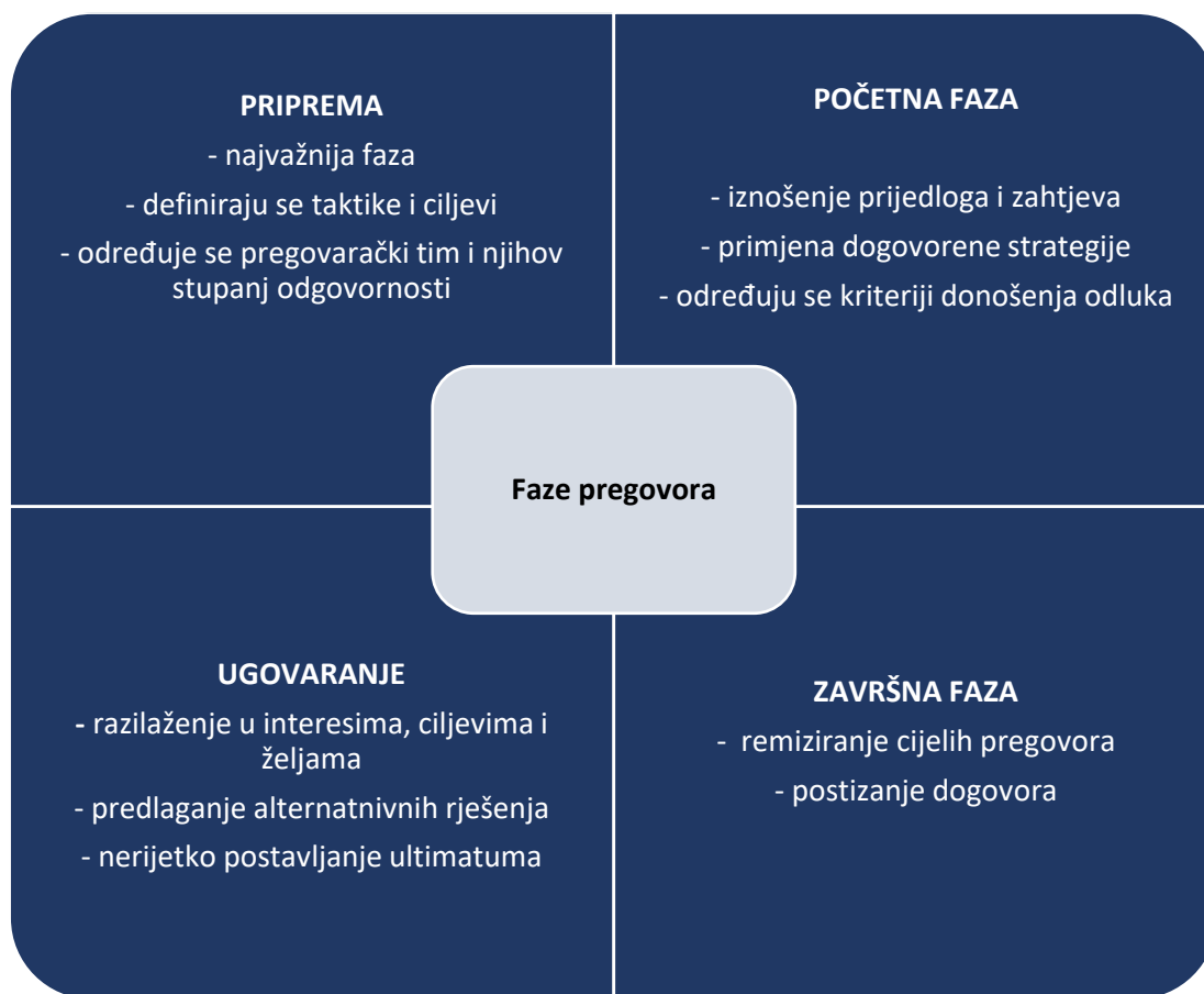
Slika 1 Faze pregovora