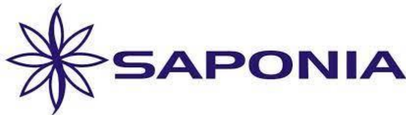
Slika 4. Logo Saponije

Saponia je dio Mepas Grupe koja u svom portfelju ima nekoliko značajnih poduzeća proizvođača priznatih hrvatskih brendova. U vlasničkoj strukturi Saponije, Grupa Mepas sudjeluje s 87,3% udjela u kapitalu. Tijekom više od 125 godina postojanja Saponia se razvila u vodećeg proizvođača deterdženata i proizvoda osobne higijene u ovom dijelu Europe, s oko 750 zaposlenih.