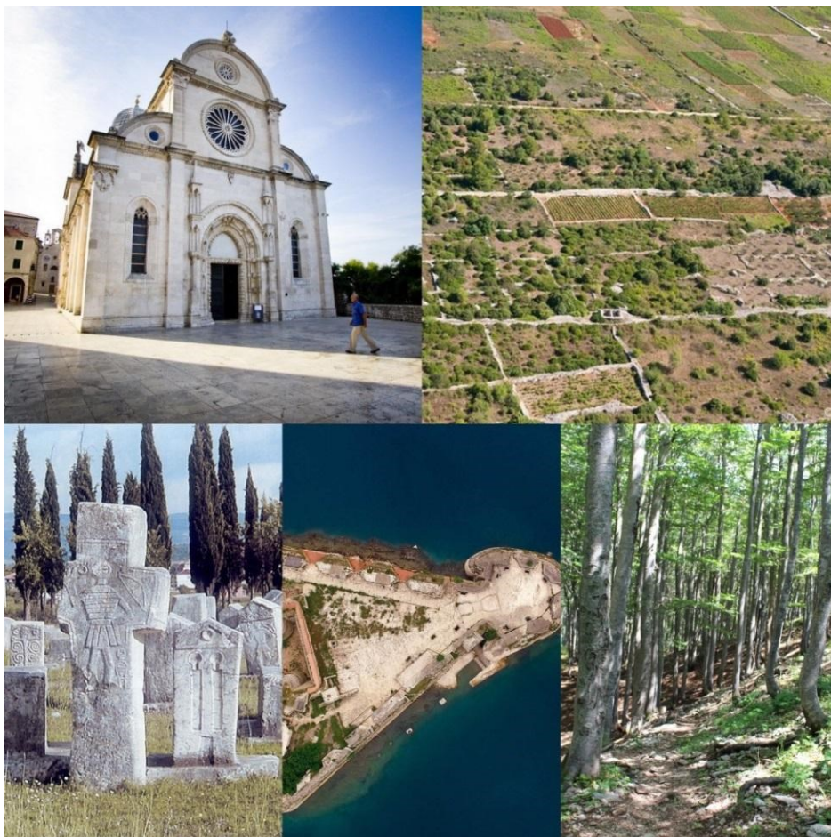
Slika 9: Katedrala Sv. Jakova, starogradsko polje, stećci, obrambeni sustav Republike Venecije, bukove šume (s lijeva na desno, od gore prema dolje)