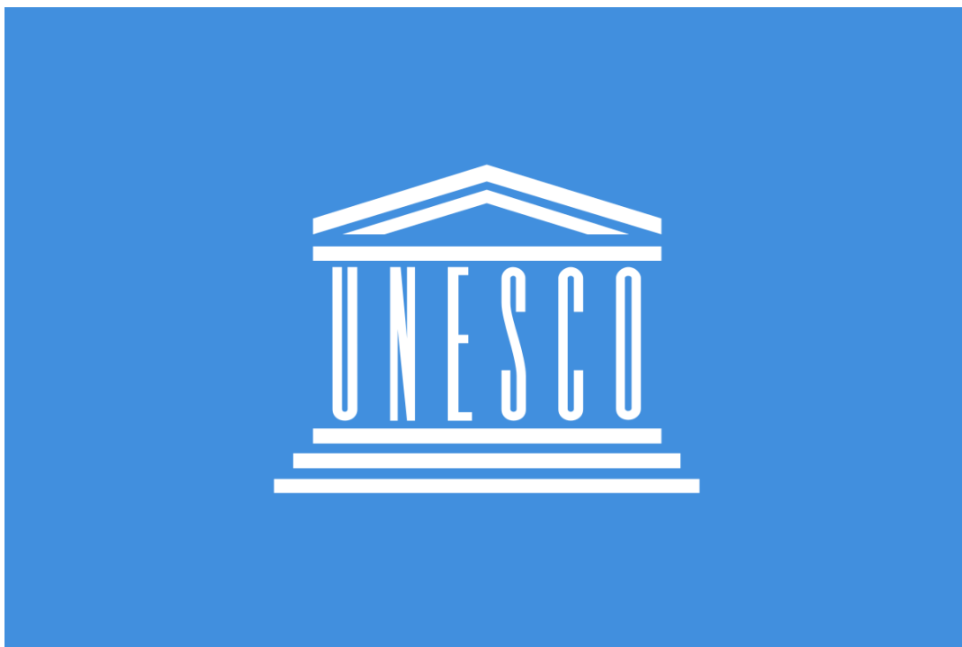
Slika 3: UNESCO

Izvor: https://hr.wikipedia.org/wiki/UNESCO (preuzeto 29. studenog 2022.)