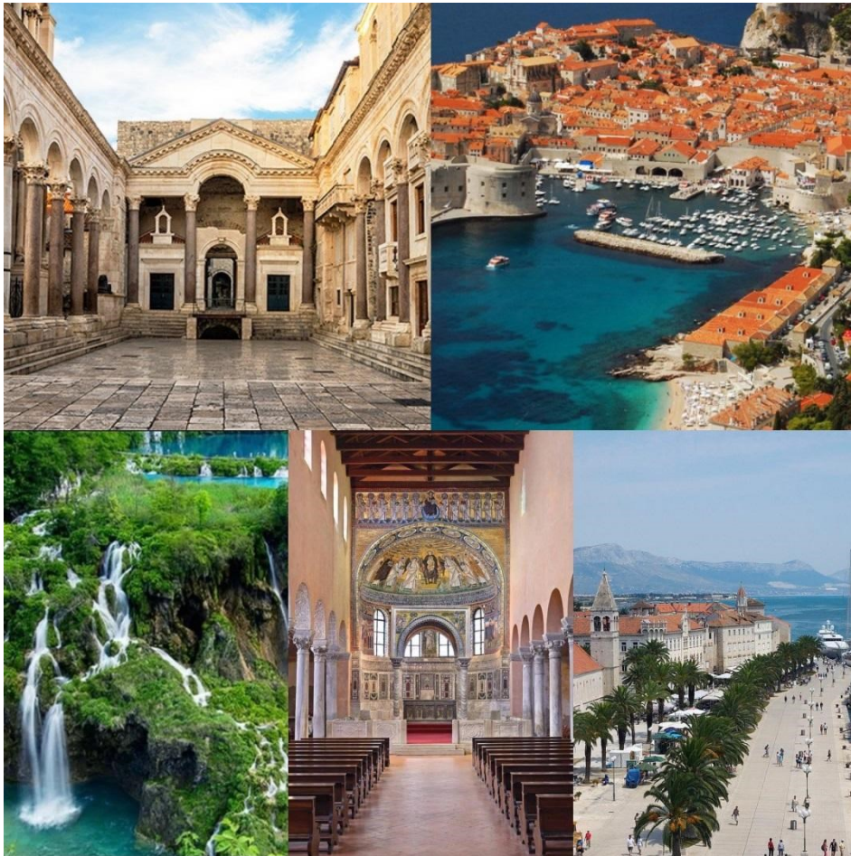
Slika 8: Dioklecijanova palača, grad Dubrovnik, Plitvička jezera, Eufrazijeva bazilika, grad Trogir (s lijeva na desno, od gore prema dolje)