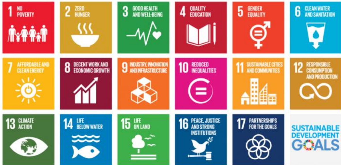
Slika 1.: 17 ciljeva održivog razvoja

(Dostupno na: https://i0.wp.com/odgovorno.hr/wp-content/uploads/2021/06/Sustainable-Development-Goals.png?resize=768%2C593&ssl=1 , pristupljeno: 03.05.2023.)