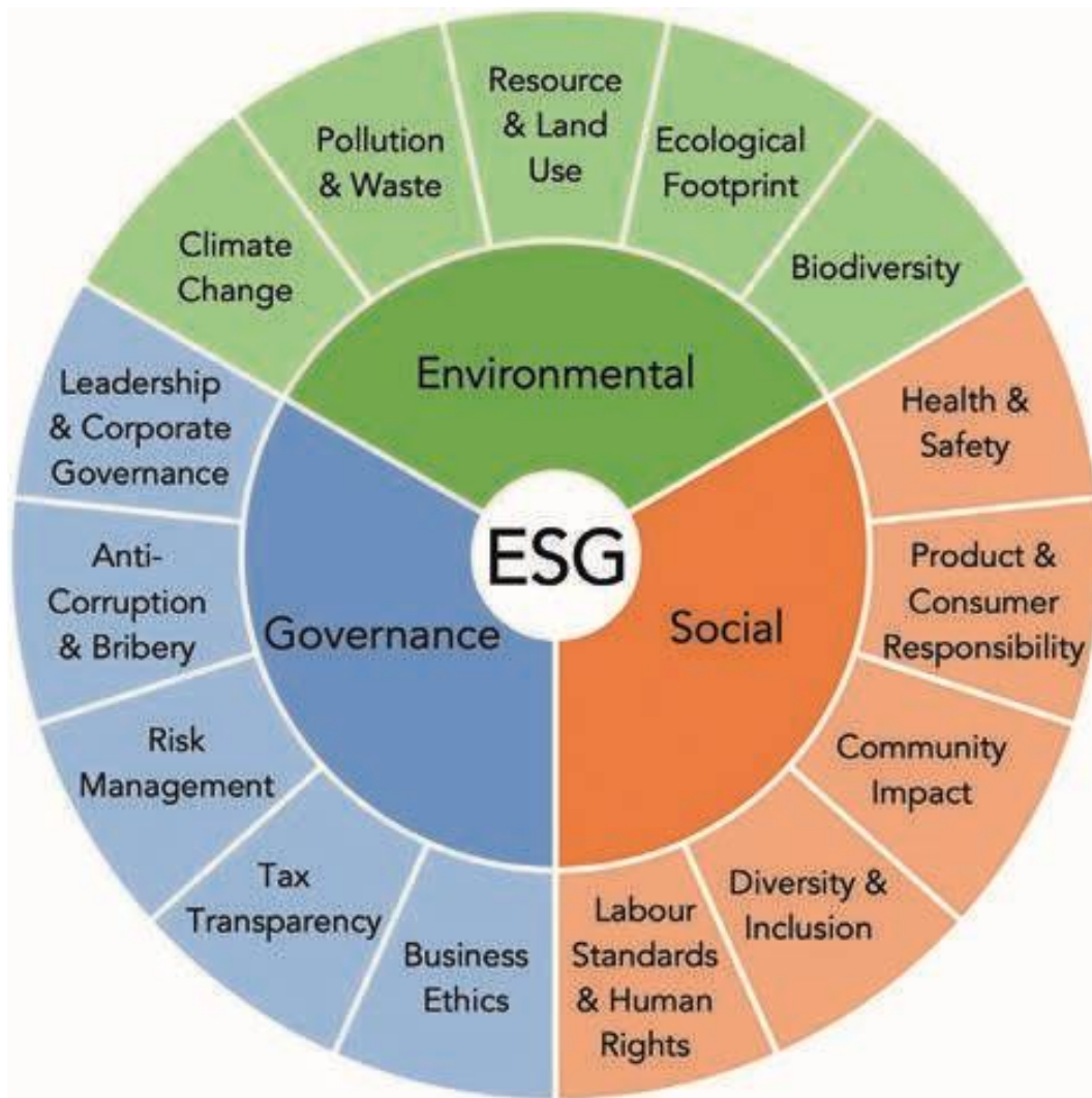
Slika 2.: ESG model

Za provedbu ovih ciljeva, tvrtke često usvajaju ESG model koji prikazuje Slika 2 :