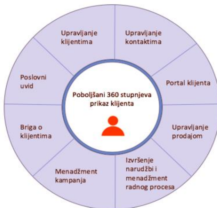
Slika 1. Osnovni koncept CRM-a i usmjerenost na klijenta