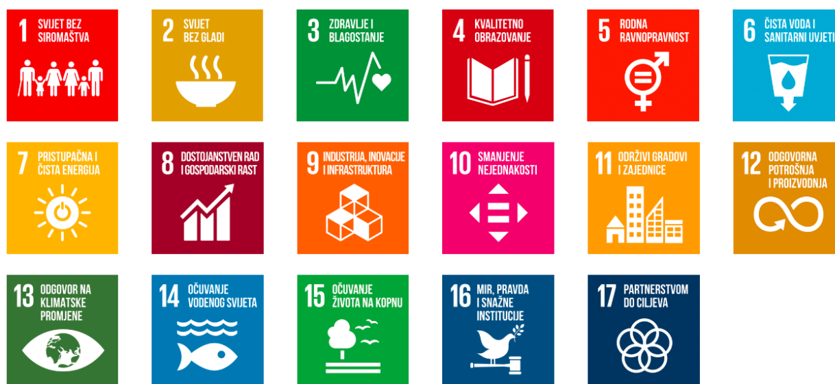
Slika 2: Ciljevi održivog razvoja