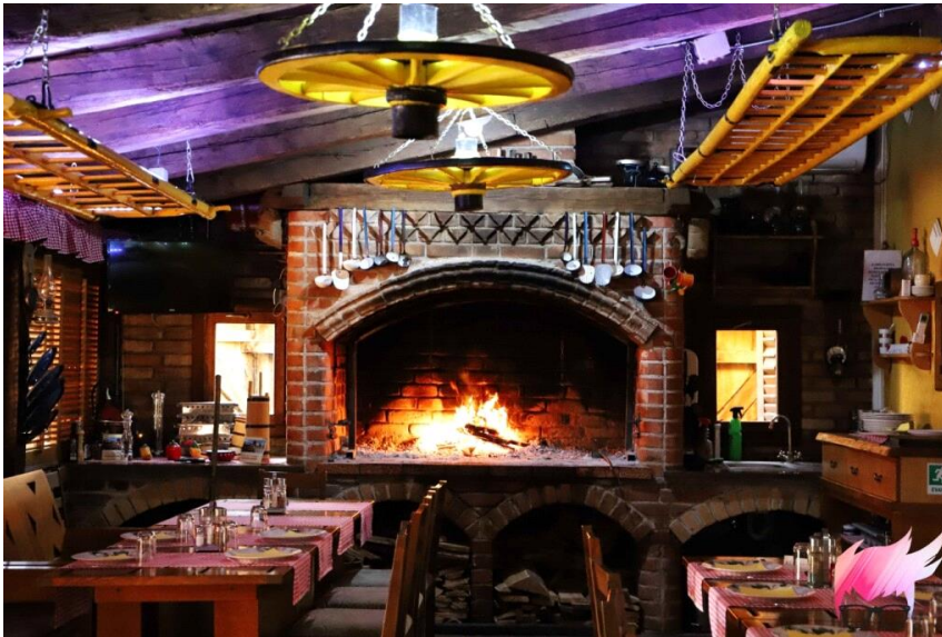
Slika 12: Kuća dida Tunje