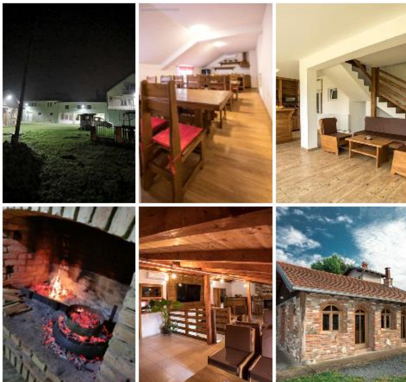
Slika 10: Seosko gospodarstvo Salaš