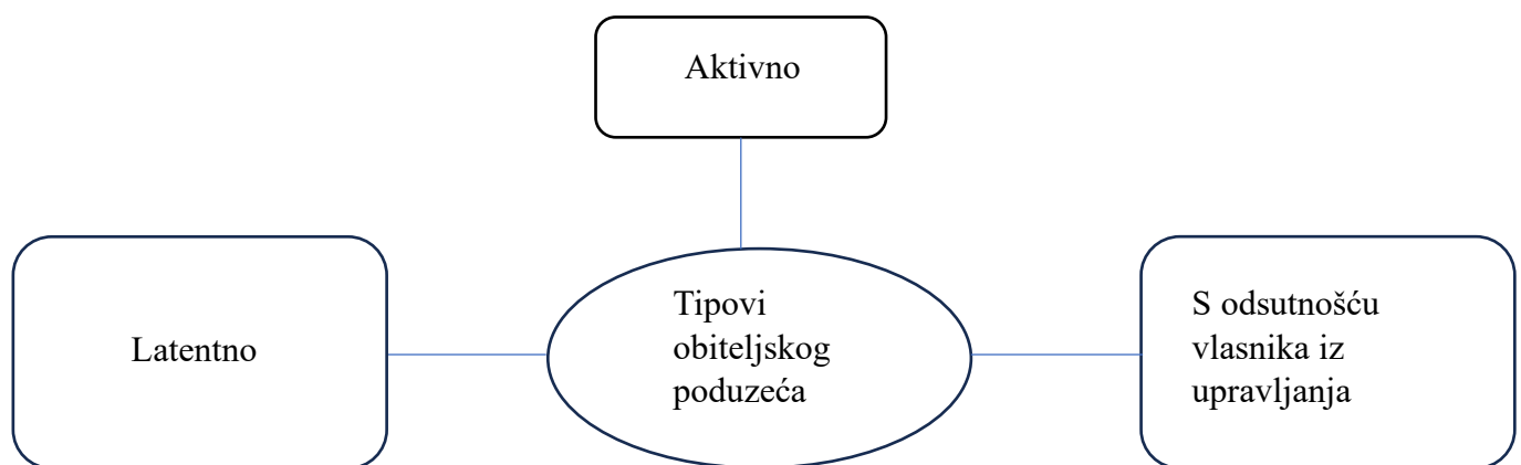
Grafikon 1: Tipovi obiteljskog poduzeća