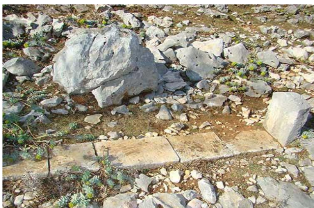
Slika 10. Mirila