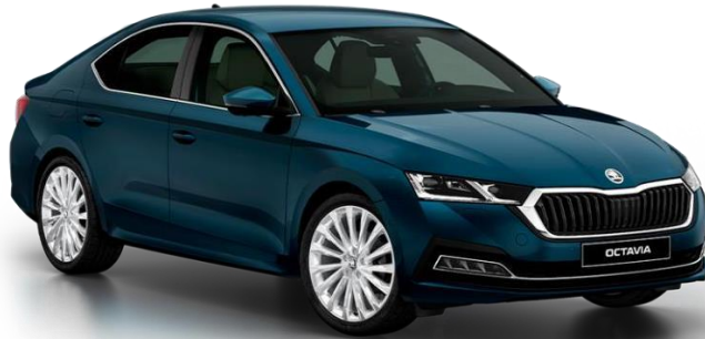
Slika 2: Najprodavaniji model vozila u Republici Hrvatskoj