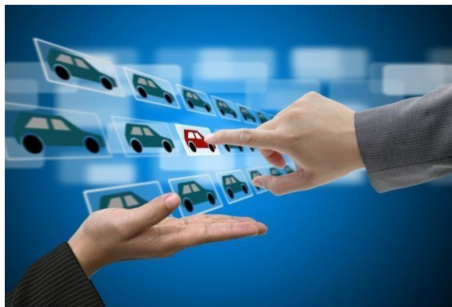
Slika 3: Online kupnja automobila