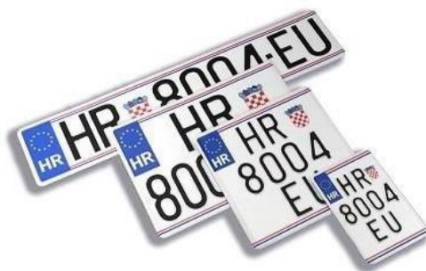
Slika 4: Vrste registracijskih oznaka u Republici Hrvatskoj