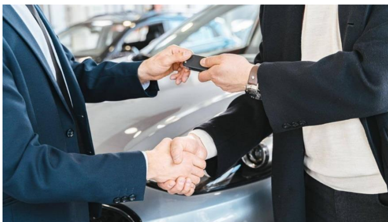
Slika 5: Prodaja automobila