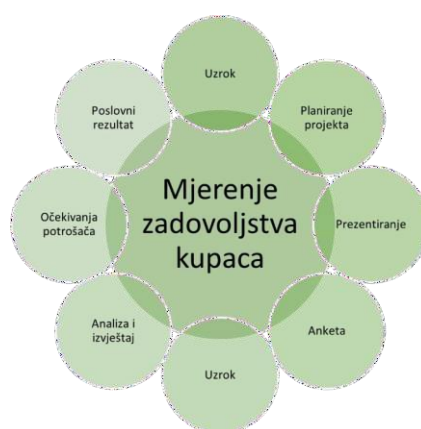
Slika 6: Proces mjerenja zadovoljstva kupaca

Sve ove čimbenike treba pažljivo upravljati kako bi se osiguralo visoko zadovoljstvo kupaca, jer zadovoljni kupci često postaju lojalni kupci i daju pozitivne preporuke. (Kompere 2020.)