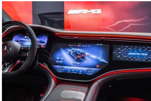
Slika 1: Infotainment sustav vozila