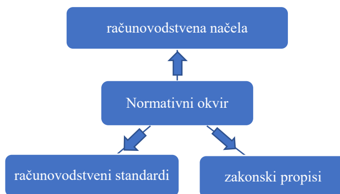
Slika 1. Normativni okvir financijskog izvještavanja u Republici Hrvatskoj