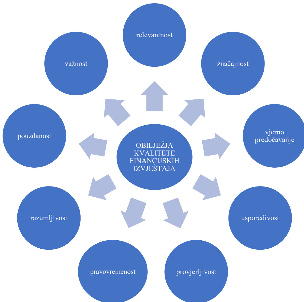
Slika 3. Obilježja kvalitete financijskih izvještaja