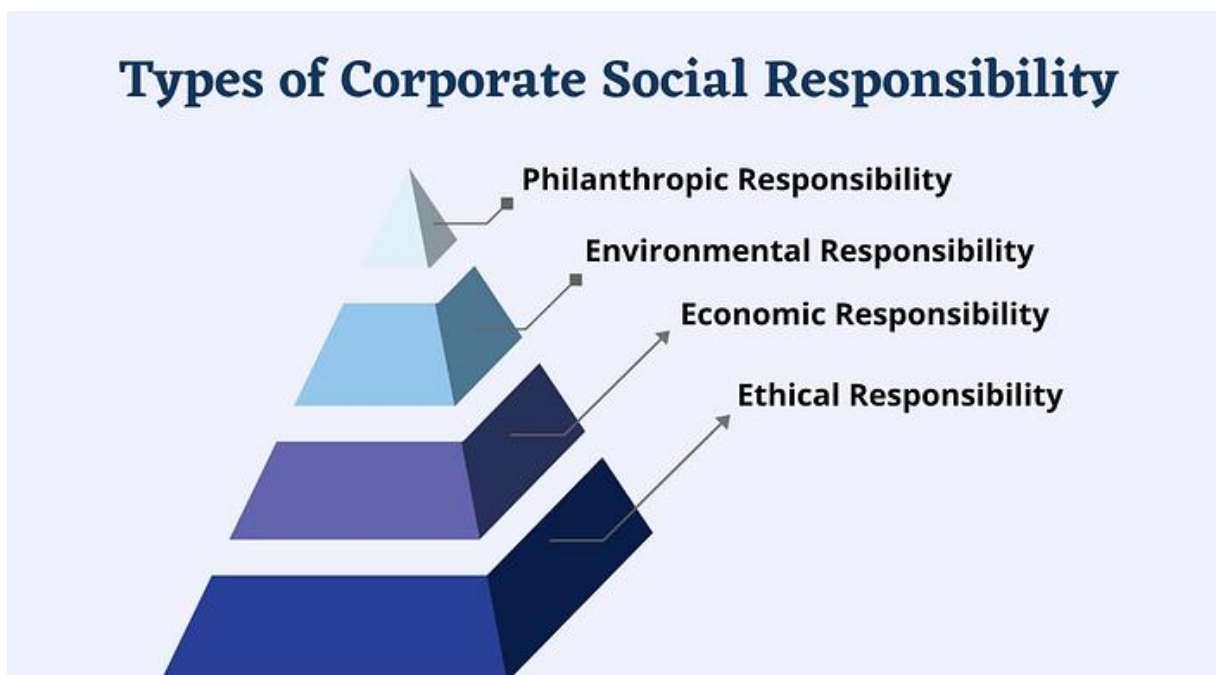
Slika 2. Četiri tipa društveno odgovornog poslovanja