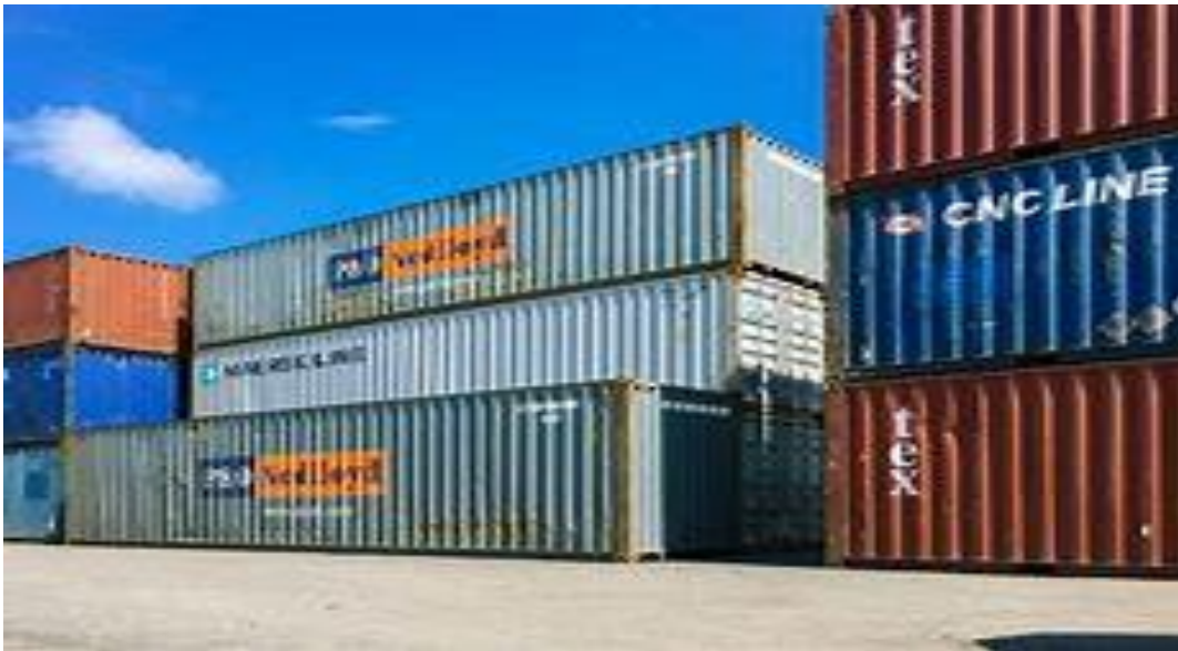
Slika 1: Prikaz kontejnera kao osnovne transportne jedinice