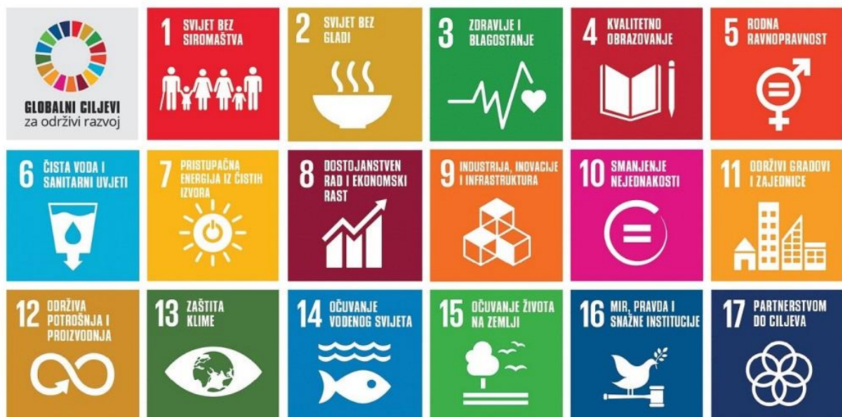
Slika 2. Globalni ciljevi za održivi razvoj