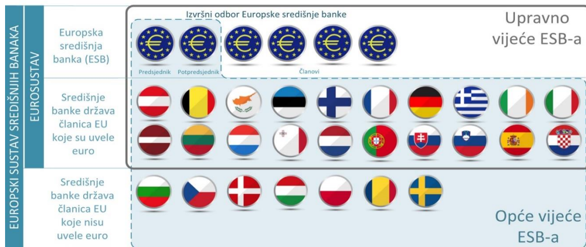
Slika 5. Europski sustav središnjih banaka i Eurosustav