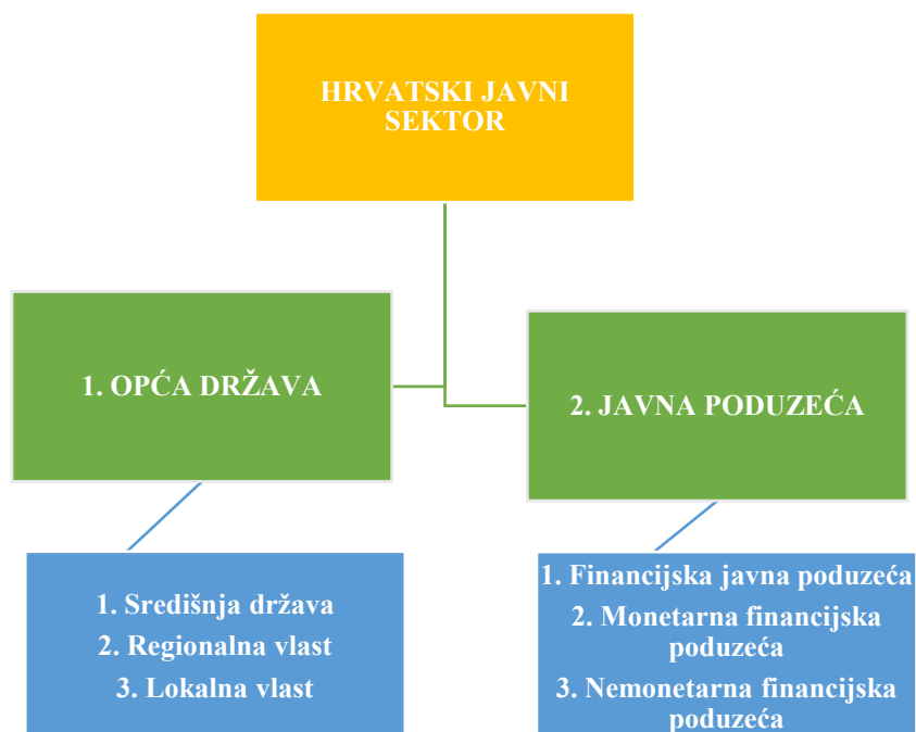
Slika 1. Prikaz hrvatskog javnog sektora

Izvor: obrada autora prema Bejaković, P., Vukšić, G., Bratić, V., (2011.), Veličina javnog sektora u Hrvatskoj. Hrvatska i komparativna javna uprava, 11(1), 107.