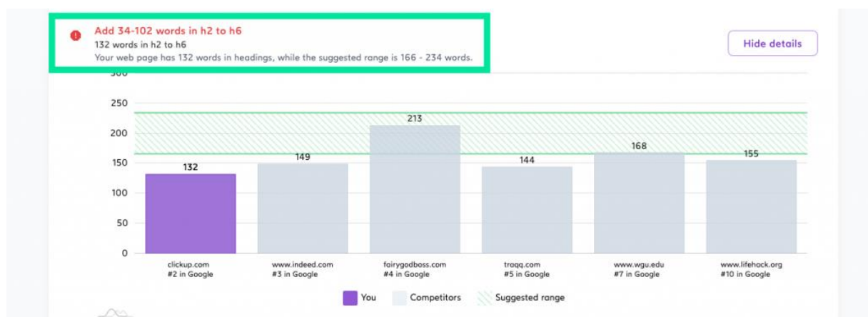
Slika 2. ClickUp sustav