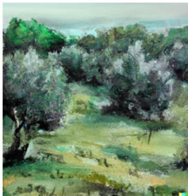
A painting of an olive tree grove (generated by AI)