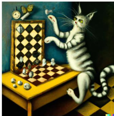
A surrealist dream-like oil painting of a cat playing checkers, Dali style (generated by AI)

Slika 4. Primjer slika kreiranih primjenom alata umjetne inteligencije