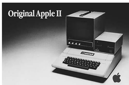
Slika 4.: Računalo IV. generacije računala 11