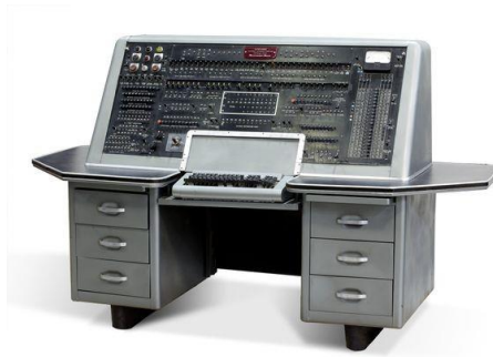
Slika 1.: Najpoznatije računalo I. generacije računala – „UNIVAC“ 5