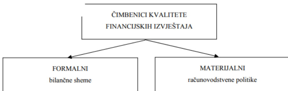
Slika 1. Čimbenici kvalitete financijskih izvještaja

Krucijalan element kvalitete u tom slučaju predstavljaju upravo računovodstvene politike. Njima je u znatnoj mjeri, i to politikom procjene, moguće utjecati na vrijednost pozicija financijskih izvještaja. Iz toga slijedi zaključak da je kvalitetu financijskih izvještaja nužno promatrati iz formalne, ali i materijalne perspektive. Slika koja slijedi u nastavku prikazuje čimbenike kvalitete financijskih izvještaja.