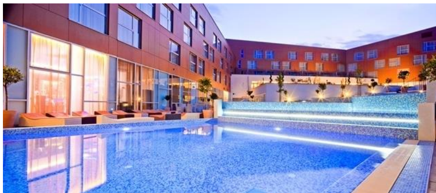
Slika 2. Lifeclass Terme Sveti Martin