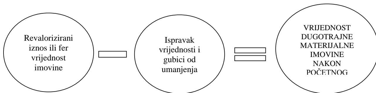
SLIKA 3. Shema izračuna modela revalorizacije